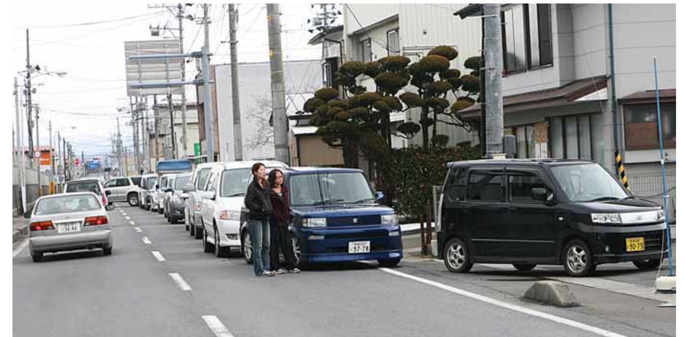
市内の各所で給油待ち渋滞が発生

しかし、市内の給油所には給油を求め連日長蛇の列が発生した。給油所では一人当たりの購入量を制限しながら在庫を販売していたが、県内全域で製油から輸送までの燃料供給が滞っていたため、市内の給油待ちが緩和されたのは4月中旬を過ぎた頃だった。