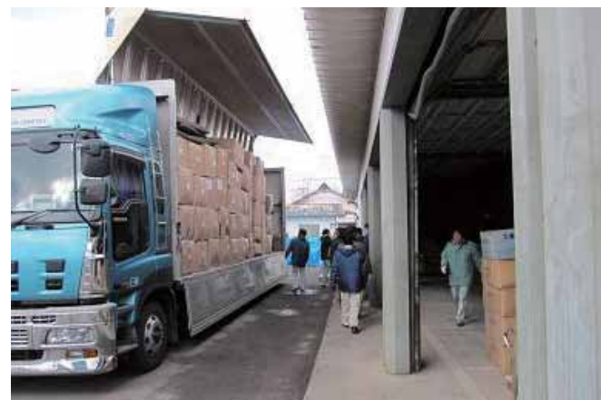
登米合同庁舎に到着した物資は車庫に保管された