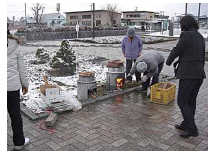
薪を使った炊き出しが各所で行われた