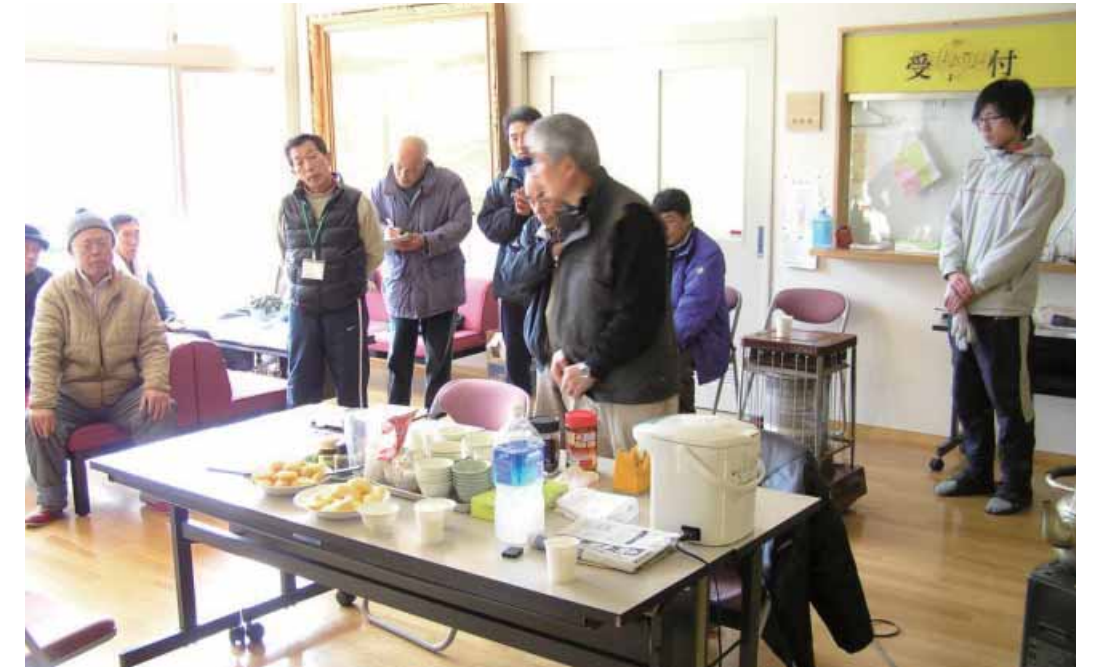
運営方針を話し合う地区代表者(米川公民館)

このような地域コミュニティ独自の活動は、東日本大震災のように被害が広域で長期に避難所生活が続くとき、平素からの地域コミュニティがいかに大切であるかをあらためて考える機会となった。