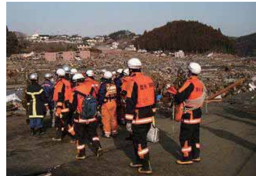
大崎ブロック隊(登米、大崎、栗原)

大崎ブロックでは大崎地域広域行政事務組合消防本部、栗原市消防本部及び登米市消防本部から気仙沼・本吉地域広域行政事務組合消防本部に対し、塩釜ブロックでは黒川地域行政事務組合消防本部が塩釜地区消防事務組合消防本部に対し仙南ブロックでは仙南地域広域行政事務組合消防本部から名取市消防本部、岩沼市消防本部及び亶理地区行政事務組合消防本部に対して県内広域消防応援隊を編成及び被災地へ派遣を行い救助活動、人命検索及び後方支援活動を実施した。