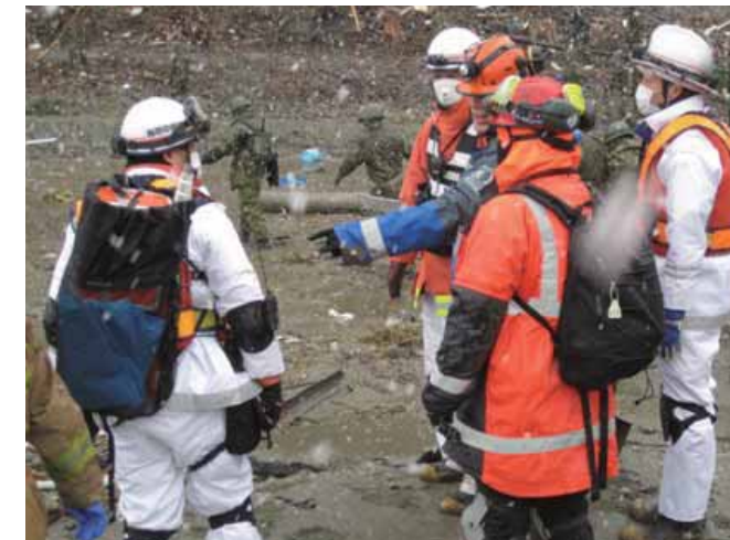
南三陸町で活動するニュージーランド隊