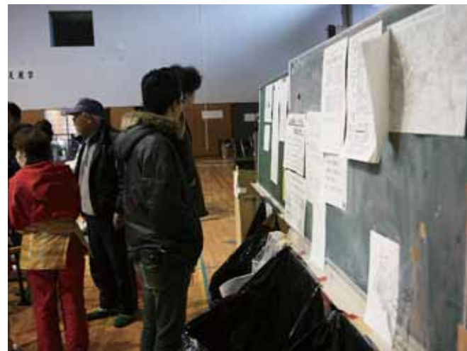
掲示された情報を確認する