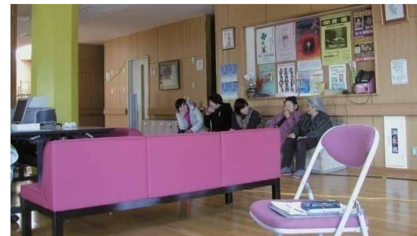
避難所受付(米川公民館)