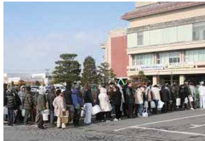
給水に並ぶ住民の列(迫総合支所前)

水道事業所では住民の飲み水を最優先に考え、時間給水や給水所を移動させながら弾力的に対応した。また、県外から駆け付けてくれた給水支援隊の応援もあって、より多くの給水所を展開することができた。