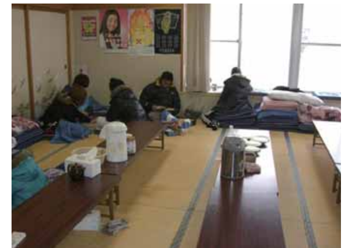
自主防災組織が開設した地域避難所