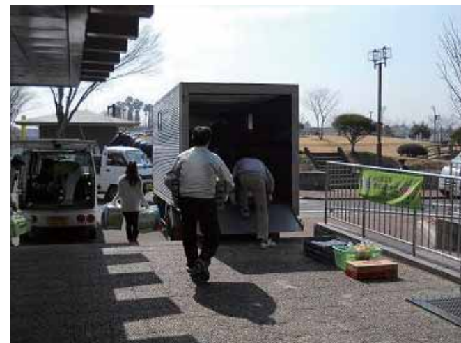
給食配送車に積み込み避難所へと向かう