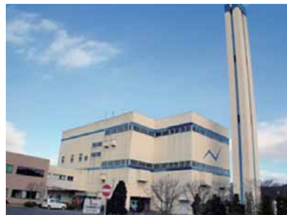
クリーンセンターの処理量10年分