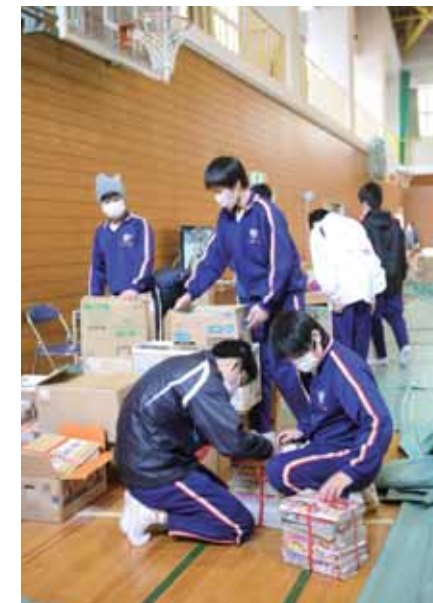
避難所を手伝う中学生たち(登米中学校)