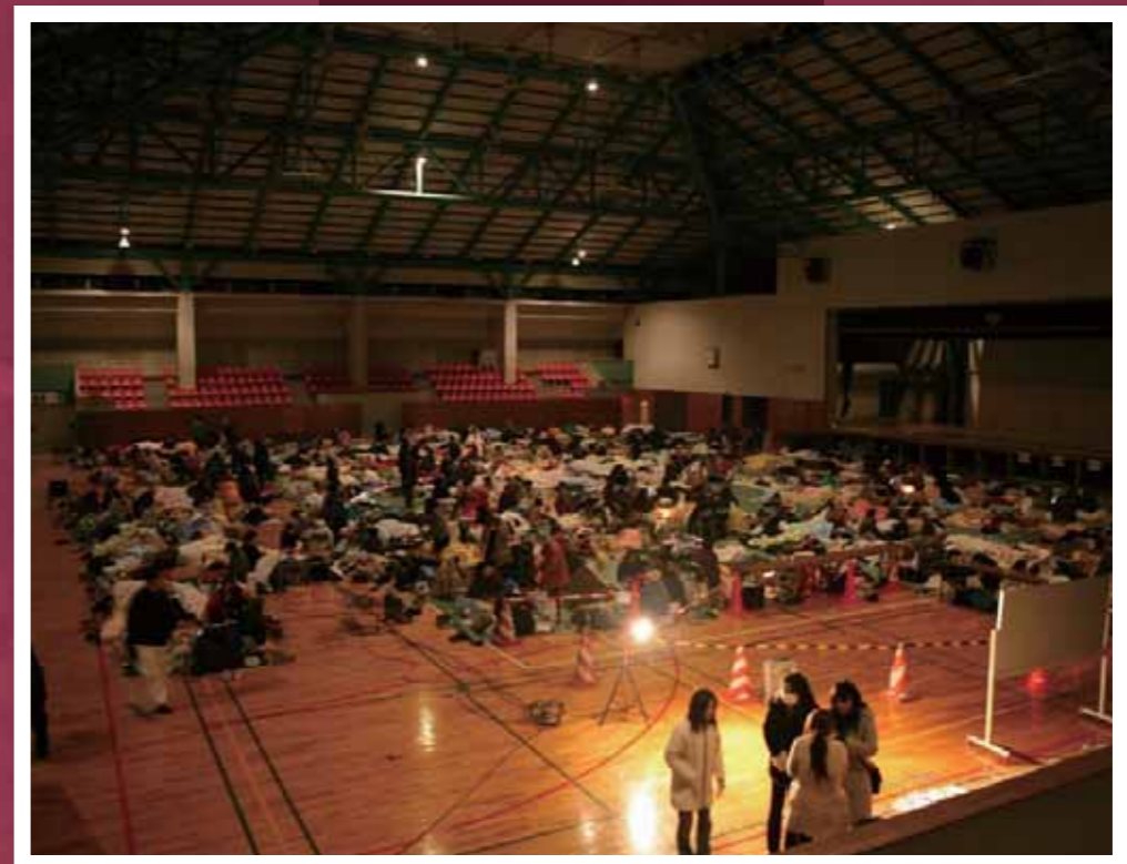
迫体育館／震災1日目の夜