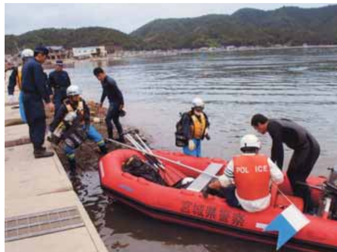
潜水捜索が連日行われた