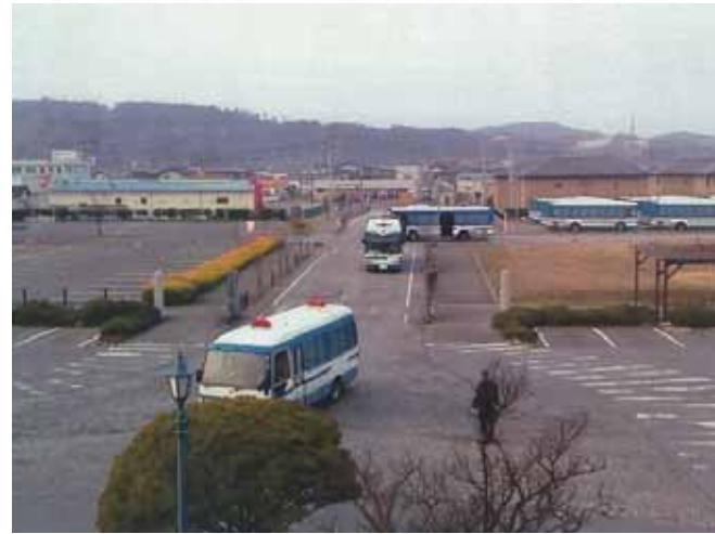
沿岸部に向けて出発する広域緊急援助隊