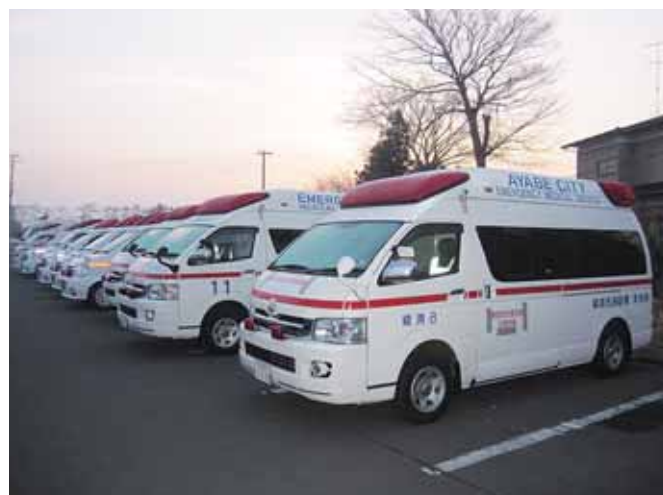
中田アリーナに集結した緊急消防援助隊(京都府隊)

宮城県では大地震の揺れと大津波による甚大な被害が予想されることから、15時36分消防庁長官に対し緊急消防援助隊の応援要請を行うとともに、宮城県庁5階において、県災害対策本部内に宮城県消防応援活動調整本部を設置した。代表消防機関(仙台市消防局)の派遣職員、総務省消防庁の派遣職員、指揮支援部隊(札幌市消防局(当初は東京消防庁が代行))が順次到着し調整本部機能を構築した。その後、気仙沼・本吉地域広域行政事務組合消防本部、石巻地区広域行政事務組合消防本部、塩釜地区消防事務組合消防本部、名取市消防本部、岩沼市消防本部、亘理地区行政事務組合消防本部から派遣要請があり、沿岸部を管轄する全7消防本部における消防応援の受援・活動調整を行った。