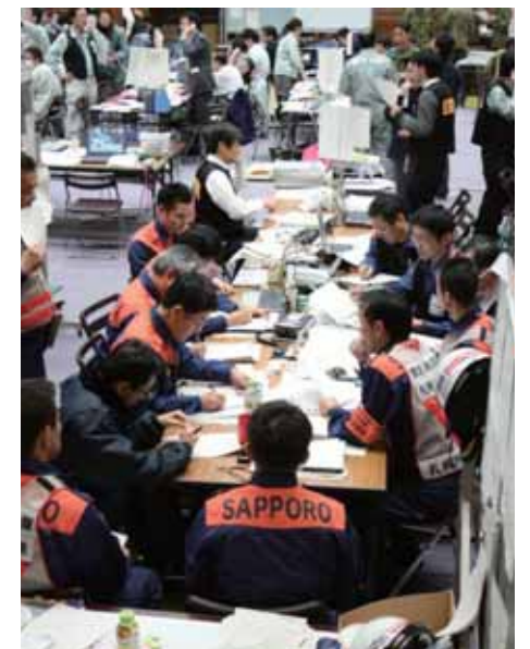
宮城県庁内の調整本部