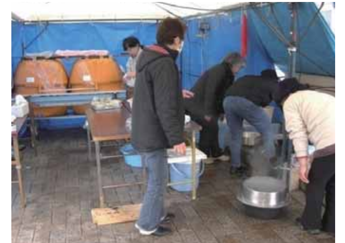
自主防災組織の炊き出し

高齢者世帯などの要援護者への食事や飲料水の配達、個別訪問による健康状態の相談などは、地元の実情に詳しい地区役員や住民が支え合うことで可能となった。