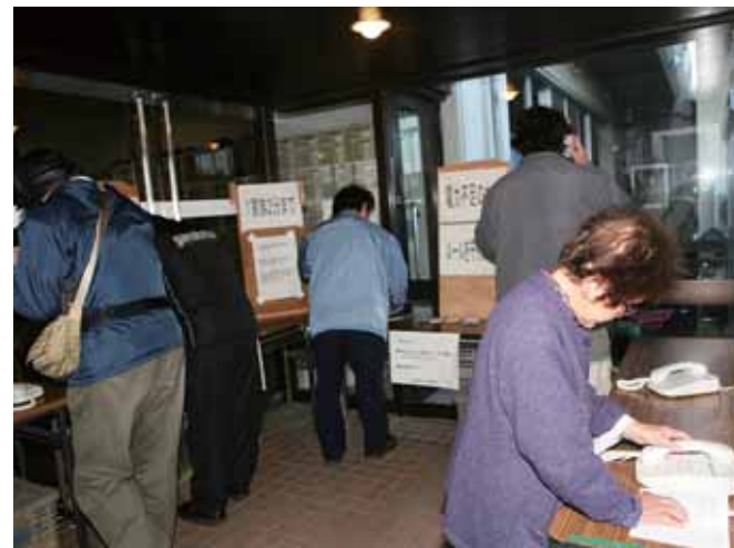
NTTが設置した特設公衆電話