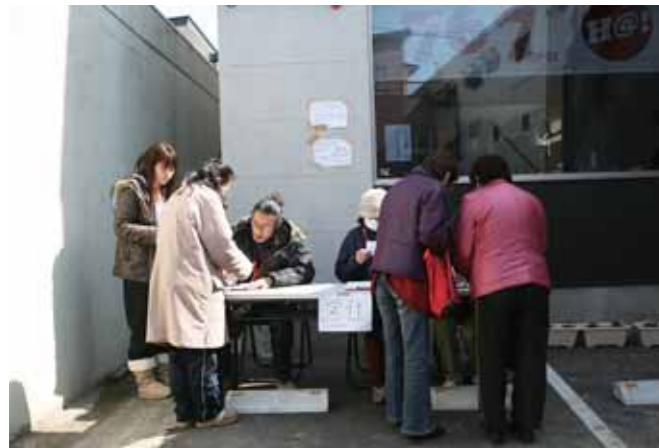
情報発信を続けたコミュニティエフエム