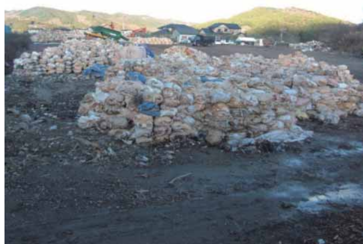
震災廃棄物の一部

発災から25カ月にわたり約20万トンの震災廃棄物を分別⇒運搬⇒破碎後、リサイクルまたは焼却、埋立処分とした。市内で発生・処理した震災廃棄物量は、市クリーンセンターにおける年間処理量約2万トン(可燃ごみ、不燃ごみ、粗大ごみ、埋立ごみの合計)の10年分に相当し、25メートルプールの水量(250トン)に換算して約800個分に相当する処理量となった。