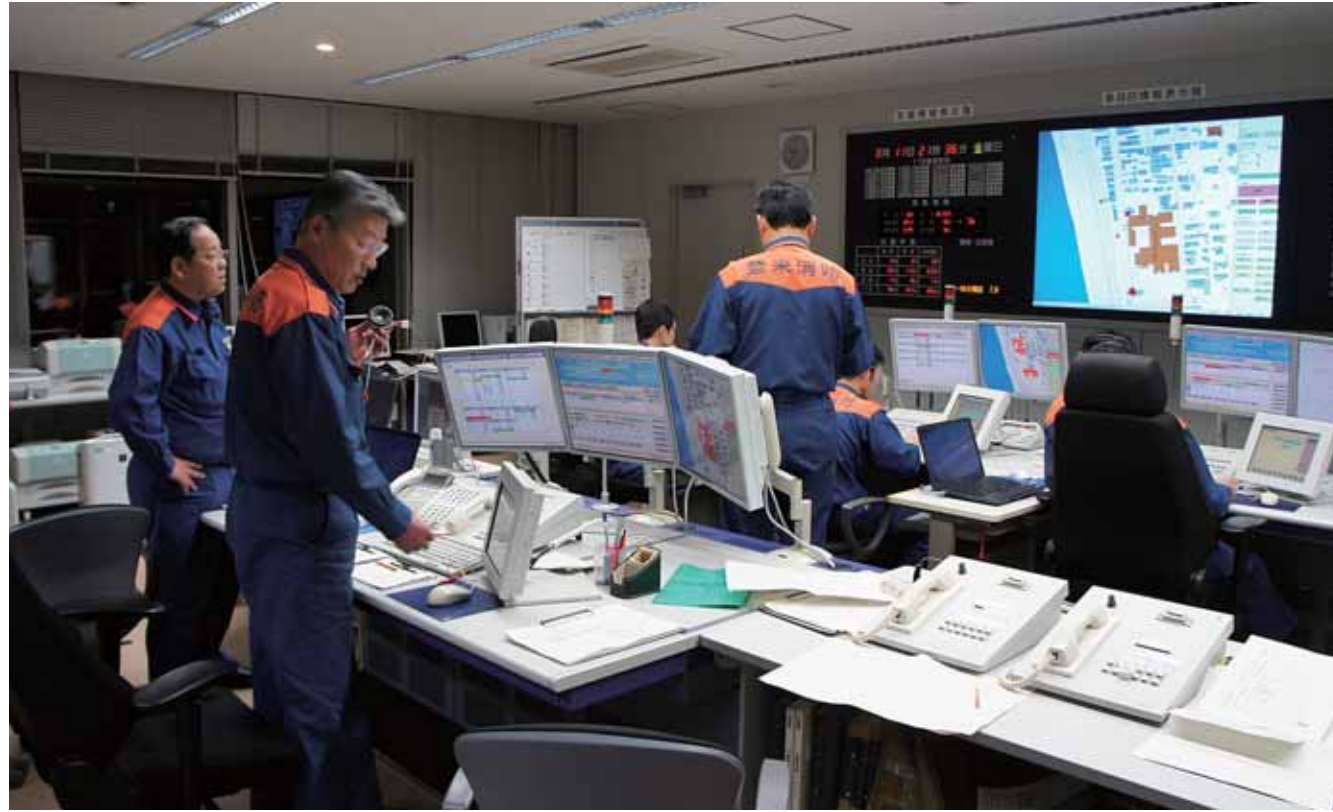
発災当日、夜の消防指令センター