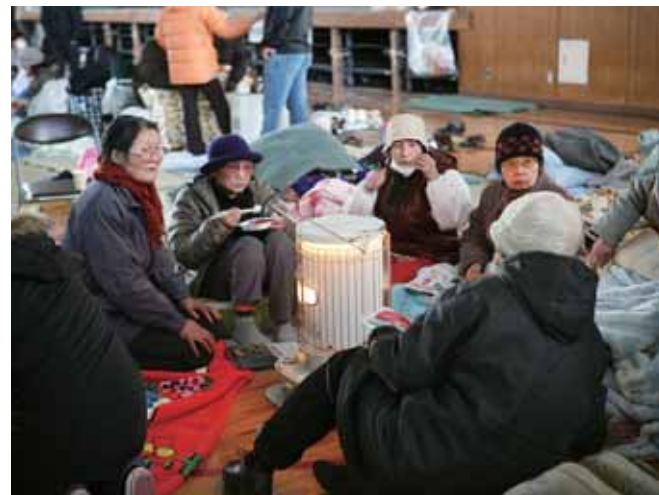
ストーブに寄り添う避難者

体育館などの大きな施設には多人数が避難していたが、停電で暖房設備が停止し底冷えする寒さだった。施設内から集めた石油ストーブは幼児や高齢者の近くに寄せた。屋外のテントでは吹雪の中で炊き出し作業が行われており、近隣の住民が持ち寄った炭や薪を焚いて暖をとった。