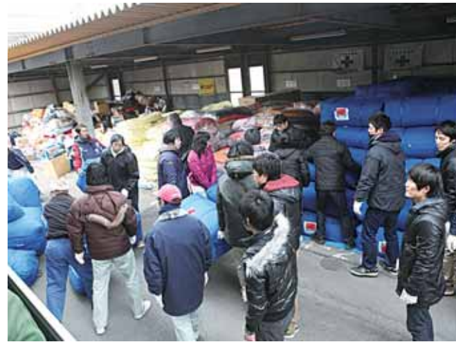
積み上げられた大量の物資

そこで、学校給食センターの給食配送車を急ぎ、物資輸送車両として使用した。本来給食配送車は衛生状態を保つため給食以外の積載物を積むことはありえなかった。しかし事態は急を要しており、躊躇している時間はなかった。積載力が大きいコンテナ車によって配送効率は格段に向上した。また、市内給油所の在庫は、ガソリンはわずかだったが軽油に関してはある程度の在庫量があったため、継続して車両を稼働させることができた。