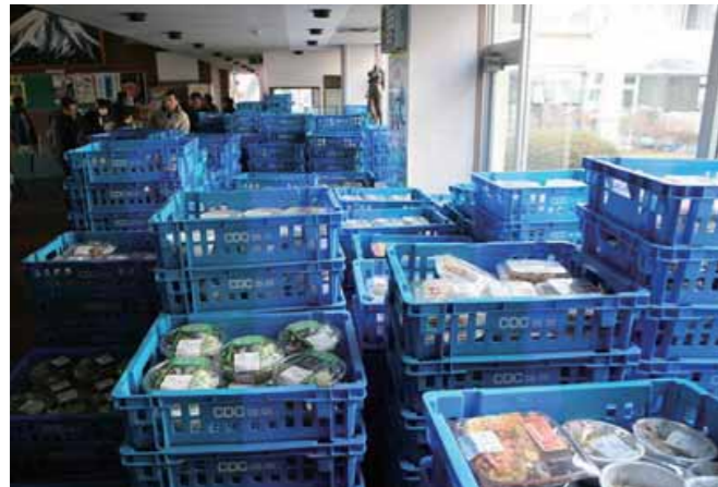
地元スーパーから届けられた食品

自らも被災していたにもかかわらず支援活動を続けた地元企業からは、地域の生活を支えるという強い信念が感じられた。