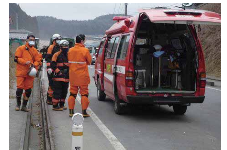
南三陸町で活動する登米市消防署消防隊

さらに、登米市消防本部からは3月11日に被害状況把握のため先行調査隊として6名を気仙沼市、南三陸町に派遣しており全体で66人が活動した。登米市消防本部は、延べ23隊、66人が活動した。