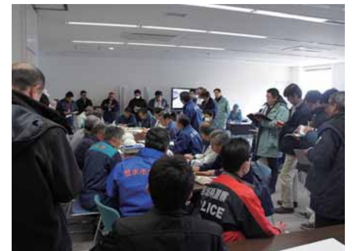
災害対策本部会議(3.12 朝)