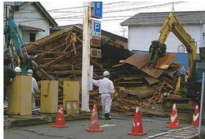
応急復旧作業(迫町佐沼地内)