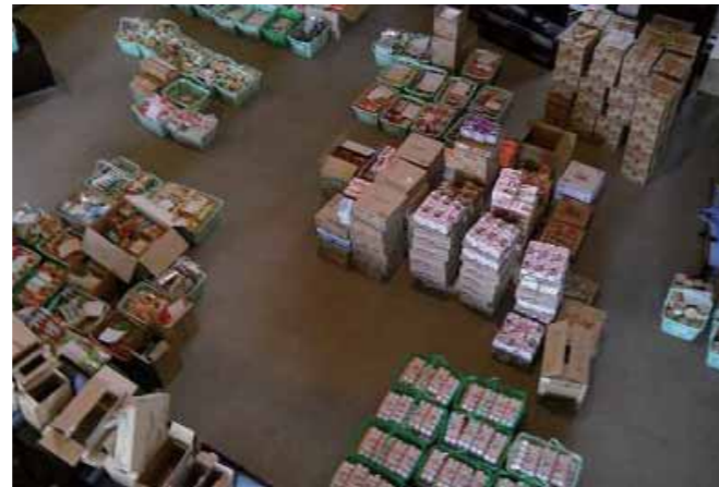
中田庁舎に届けられた食品