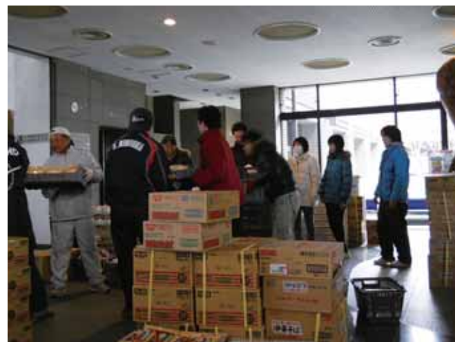
物資の積み降ろしは人海戦術