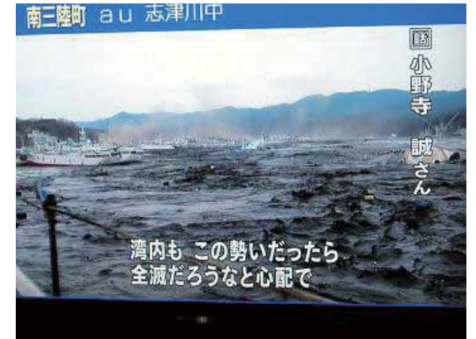
気仙沼港に襲来した津波の報道

消防防災センターは非常電源設備が稼動しており、テレビによって沿岸部に大津波が襲来する様子が報じられ、沿岸部が壊滅状態であることを認識した。