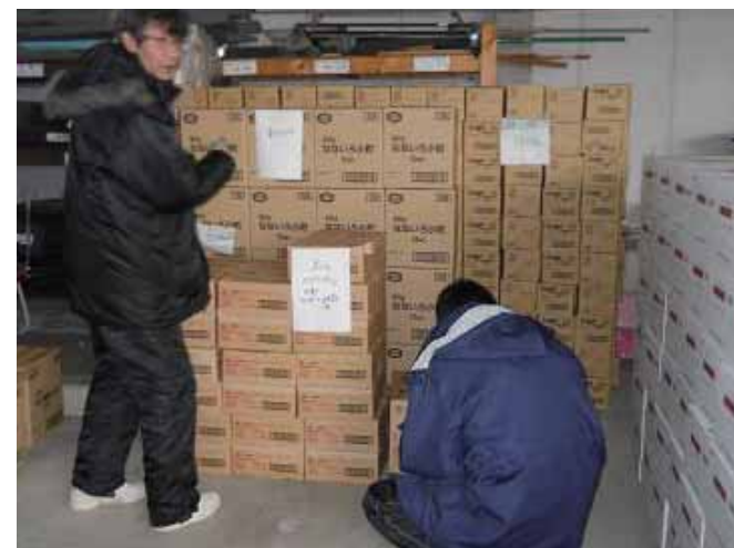
物資を仕分けする職員