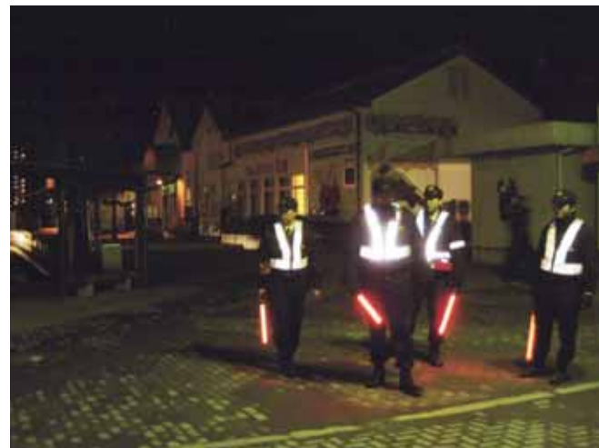
犯罪抑止の夜間パトロール