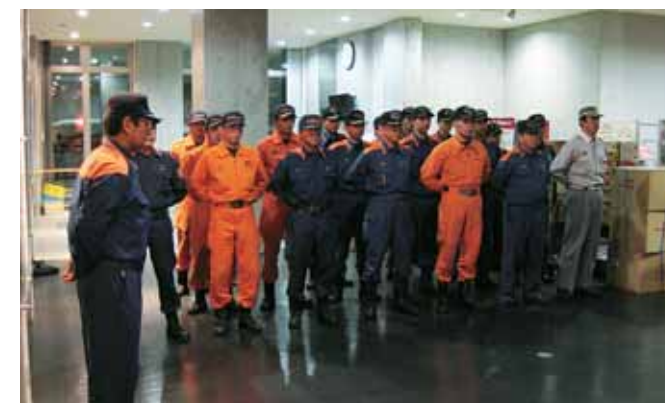
大崎ブロック隊 解散式