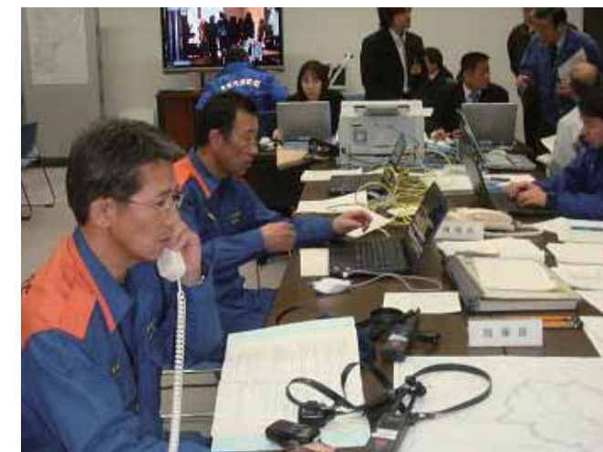
消防防災センター内の警防本部