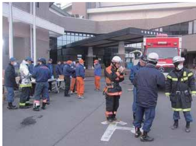
沿岸被災地出発前のミーティング