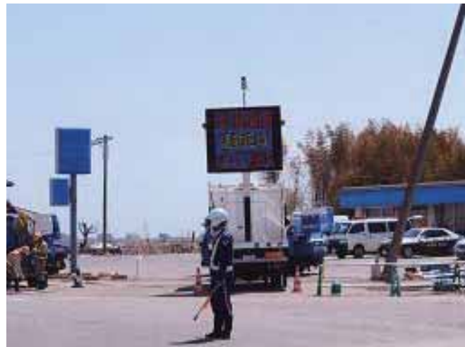
沿岸部での交通整理