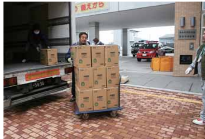
地元物流企業が物資輸送を支援