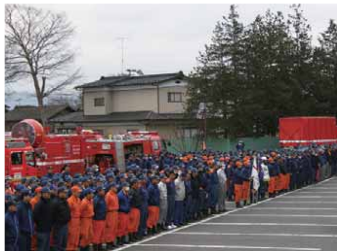
整列する京都府隊50隊187人の隊員たち

なお、緊急消防援助隊の活動内容については、「東日本大震災に伴う緊急消防援助隊北海道・東北ブロック活動検証会議」等においても検証が行われた。