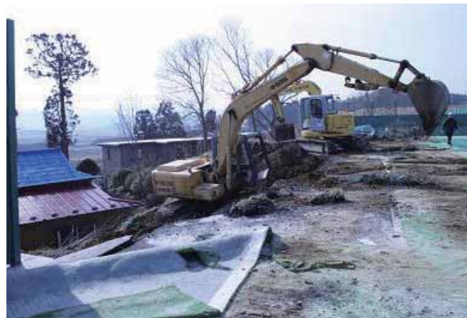
応急復旧作業(東和町錦織地内)