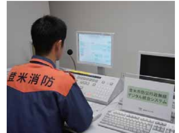
防災行政無線システム(火災発生を知らせる消防職員)

翌3月12日になると、一部の屋外子局ではバッテリーの電圧低下により放送が断続的になるなど、聞こえにくい状態となったため、3月13日には、防災行政無線放送を一時中止せざるを得なかった。