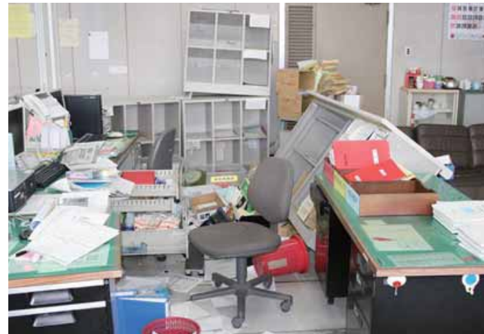
地震発生直後の事務室

そのような状況の中、臨時的に迫庁舎2階の応接室で行った第1回災害対策本部会議において本部長(市長)から、「人命最優先で対応すること」、「状況を落ち着いて把握すること」が指示された。その後、災害対策本部を第1代替場所である消防防災センターに移動することが決定された。職員は災害対策本部に必要な物品をケースやバッグに詰め、手分けして消防防災センターまで搬送した。市内は交通渋滞が発生していたため、車両での移動は時間を要すると判断し、消防防災センターまでの約2.5kmは徒歩で移動した。道中、倒壊した建物や亀裂の走る道路を目の当たりにして、あらためて地震の大きさを感じながらの移動であった。移動中は吹雪に見舞われ、大きな余震が数回発生したが、消防防災センター2階の防災会議室に災害対策本部を開設するに至った。