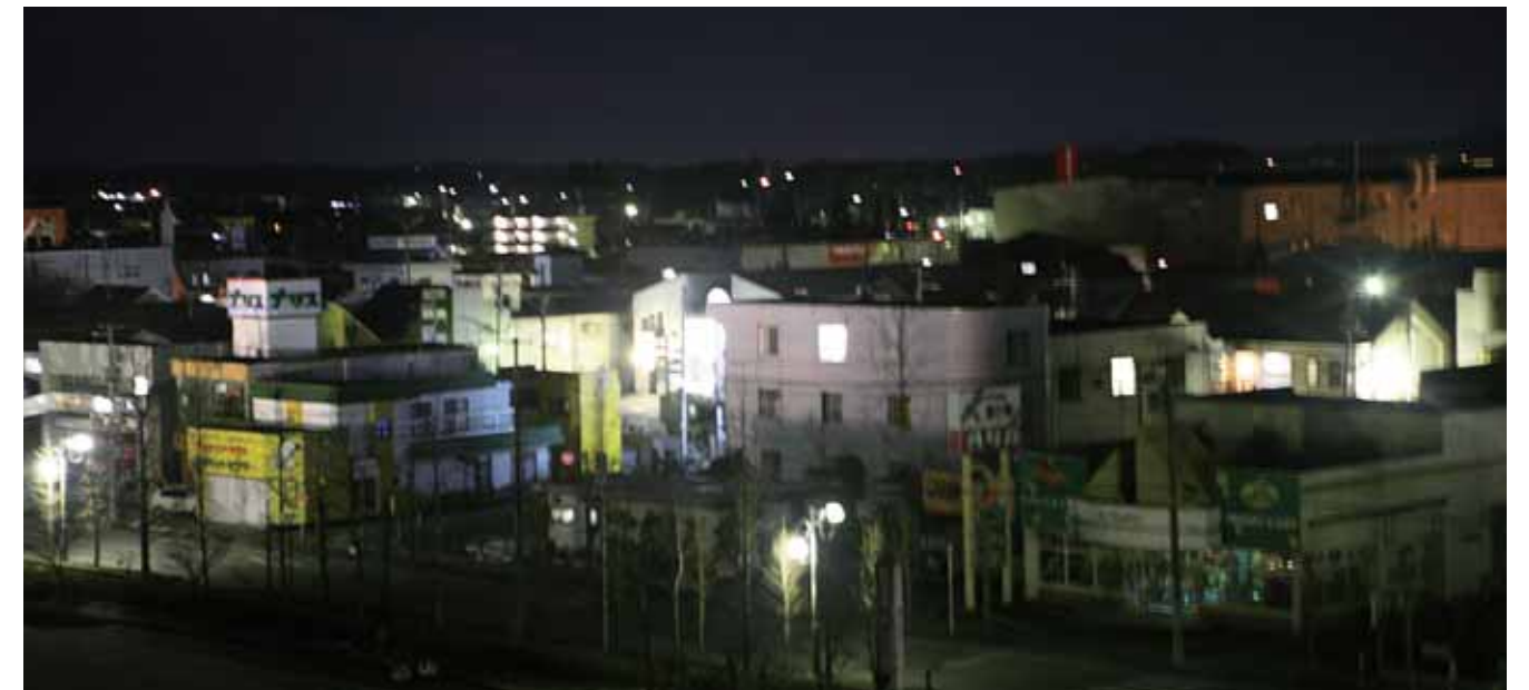
電気が復旧した夜

市外からの避難者も市内の避難所で受け入れていたが、ピーク時に833人に上った市外からの避難者も、仮設住宅やアパートへの入居が進み、新たな生活の場が確保されたことから、市は平成23年9月12日に全ての避難所を閉鎖した。