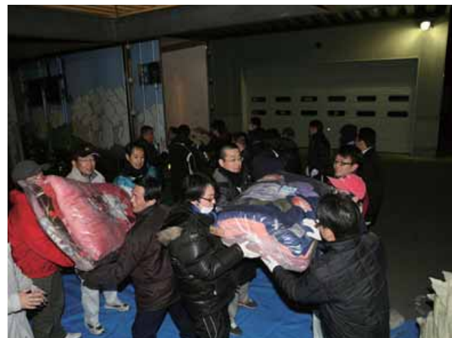
支援物資は深夜にも届く