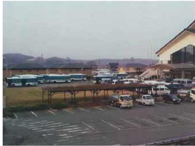
登米総合体育館に集結した広域緊急援助隊

被災地における行方不明者捜索活動を支援するとともに、遺体検視業務、被害者支援業務、避難所対策業務等にも署員を派遣するなどの活動を行い、南三陸町に全国から派遣された広域緊急援助隊の活動拠点警察署として、発災直後から応援部隊の受け入れを行い、部隊活動の後方支援を行った。