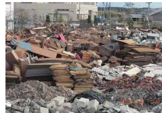
災害ごみ一次仮置場