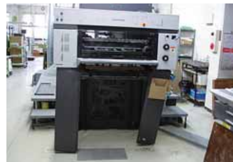
地震で損傷した印刷機

震災によって、広報紙の印刷業務を委託している迫町にある印刷工場が被災し、通常の広報紙の発行ができなくなった。そのため、広報とめ臨時号（A3版両面1枚もの）を自前印刷で発行し、4月8日付で全世帯へ配布した。