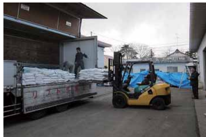
物資は仕分けされて被災地へ運ばれた