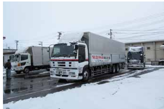
雪の中を支援物資を積んだトラックが到着した

避難所運営状況調査として、登米市内における生活環境の状況把握のため、実態調査を実施した。活動における課題として、発災直後に登米地域部及び本庁ともに、登米市と電話連絡が取れず、同市からは宮城県総合防災情報システム(MIDORI)への被害入力もなかった。原因は、登米市が災害対策本部を市庁舎から消防本部に移したためであった。庁舎の利用が困難となった場合などの連絡方法について、事前に関連機関で協議しておく必要がある。