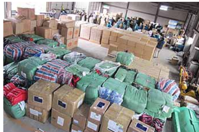
車庫内には大量の物資が積まれていった