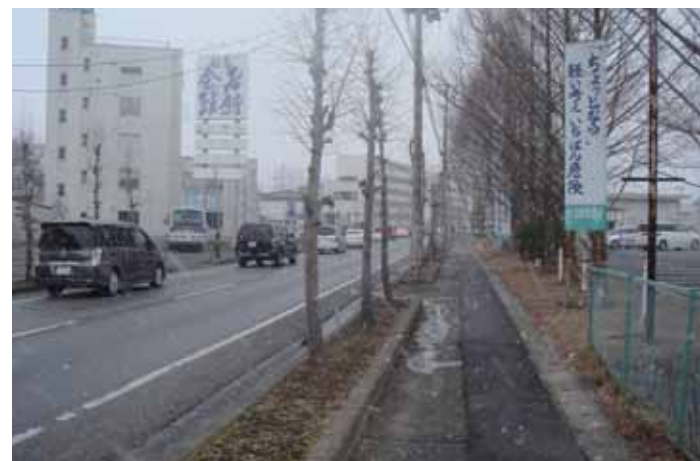
地震発生から間もなく吹雪いてきた