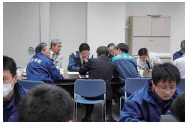
災害対策本部(消防防災センター)