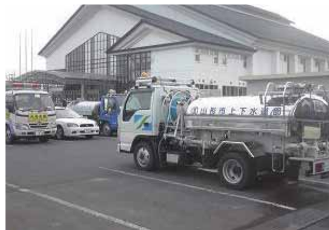
他県からの応援給水車両

本震と4月7日の余震時には正常に稼働していた保呂羽浄水場下り松取水塔の取水ポンプが、5月12日に1台、8月13日には2台が故障したことにより、市全体の25%に当たる迫川西部地区で5月に2日間、8月に3日間の断水を行った。この際には、登米市消防団に消防ポンプによる取水活動の応援を要請、災害協定締結事業体と日本水道協会の協力を得て応急給水を実施した。