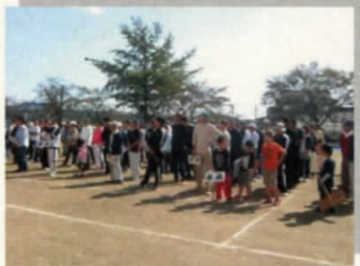
吉田地区の大運動会！