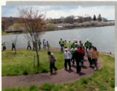
桜満開！歩け歩け大会

地区の特徴としては、多くの史跡等があり、農家戸数（特に水稻）が多いことが挙げられます。また、地区の南には水と緑に囲まれた平筒沼や憩いの森があり、憩いの場、レクリエーション、コミュニティの場として人びとに親しまれています。