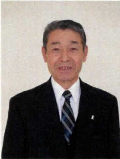
吉田コミュニティ運営協議会