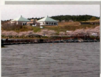
四季を通じて、平筒沼は憩いの場となっています