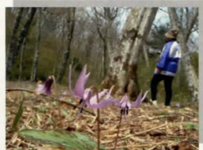
自生のカタクリや春蘭など山野草が満開に