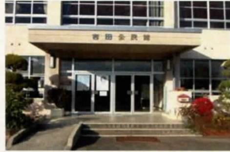
地域の活動拠点 吉田公民館

今後もコミュニティ組織の自律的な運営を目指して指定管理者制度の継続、更新に努めていきます。