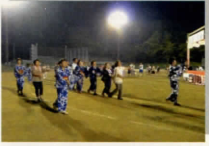
老若男女が大集合！吉田地区盆踊り大会