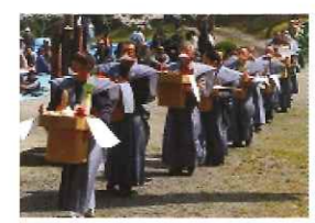
鱒淵馬頭観音春季例大祭