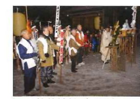
若草神社どんと祭