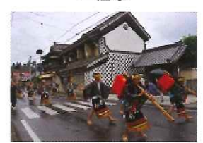
綱木之里大名行列