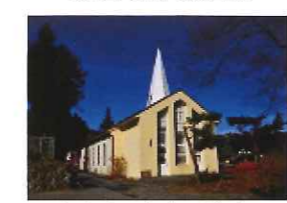
カトリック米川教会