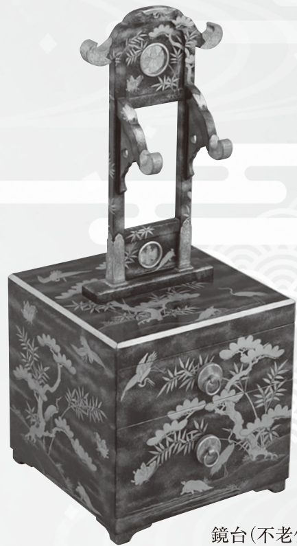
鏡台(不老仙館収蔵)