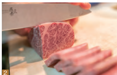
1「上カルビ」(100g・900円) 2ブロックで仕入れ、店内で手切りする肉は、厚みがあって食べ応え充分