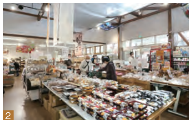
1 「仙台牛ステーキ」(3,600円) 2 産直野菜、各種お弁当 お惣菜類が多数並ぶ店内