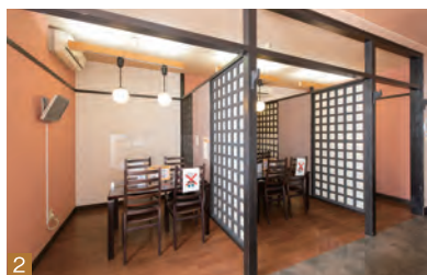
1 刺身or天ぷらなども付くお得な「登米産牛釜めし定食」(3,000円)。単品は1,500円 2 落ち着きあふれる店内