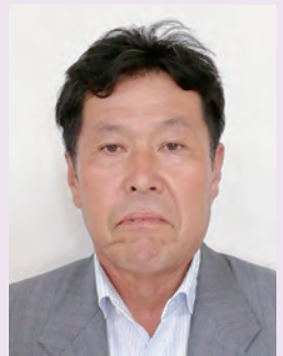
第4地区 (登米町日根牛の区域) は が て い い ち 芳 賀 定 一