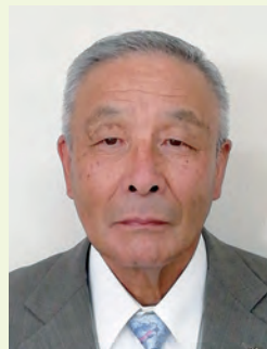
会長職務代理者(中田町)