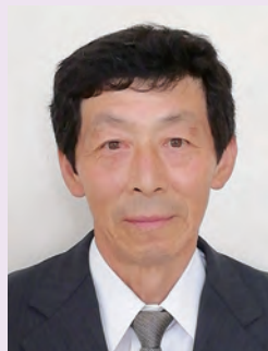
第10地区 (東和町米谷の区域) ち ば と し ゆ き 千 葉 利 行