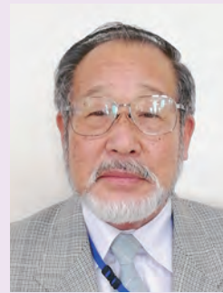
第6地区 (津山町柳津の区域) し ら い し ひ さ き 白 石 久 喜