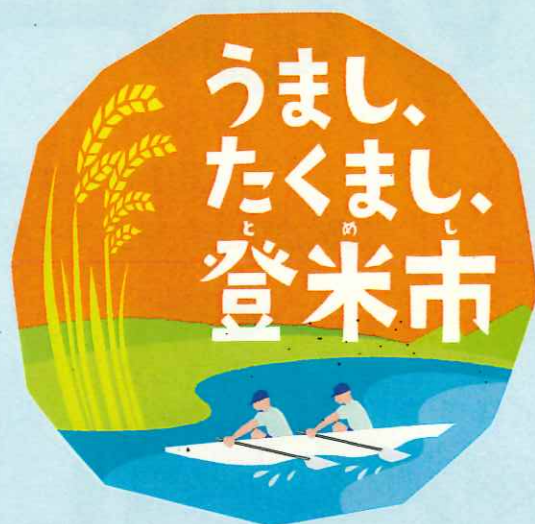
登米市シティプロモーションロゴマーク

また、国内はもとより海外の方にも登米市をPRするため、郷土料理である「はっと」を題材としたPR動画「Go!Hatto登米無双」とシティプロモーションのキャッチコピー「うまし、たくまし、登米市」に込められた、「登米市の食の恵みと豊かさ」と「絆を大切に、寛容でたくましく生きる活力」を存分に感じていただける内容の「登米無双2」、より市民を主役にした「アスリート四人衆と登米市の登米師! 登米無双3トメられぬ市民の愛篇」の制作にも取り組んできました。