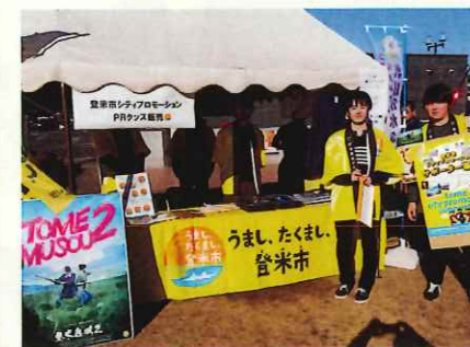
(全国はっとフェスティバルで学生によるPR)