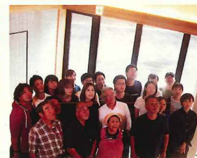
(PR動画「登米無双3」の撮影)