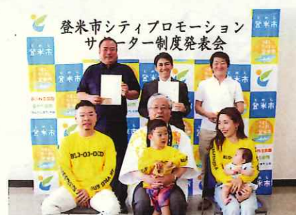
(サポーター制度発表会)