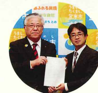
(大阪府堺市立金岡南小学校教諭 表敬訪問)