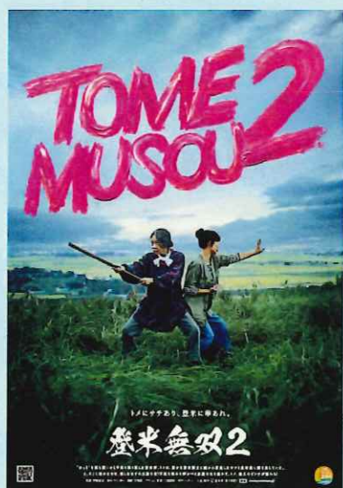
「登米無双2」 映画再生回数 81万回