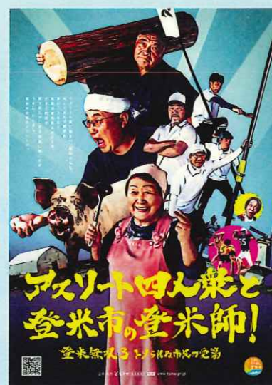
「アスリート四人衆と登米市の登米師! 登米無双3トメられぬ市民の愛篇」 映画再生回数 103万回 (令和元年5月1日現在)