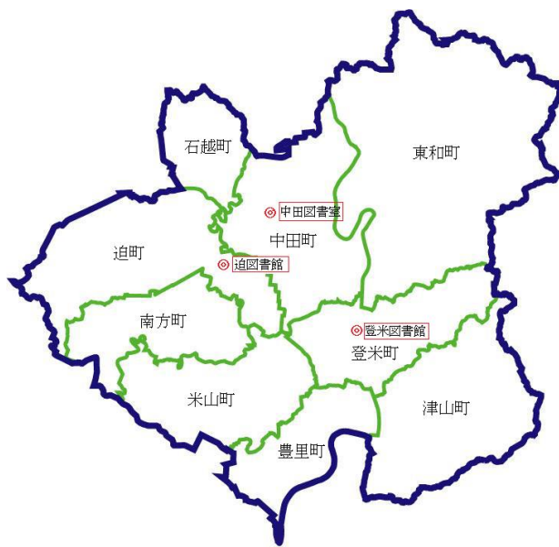
市立図書館等の位置