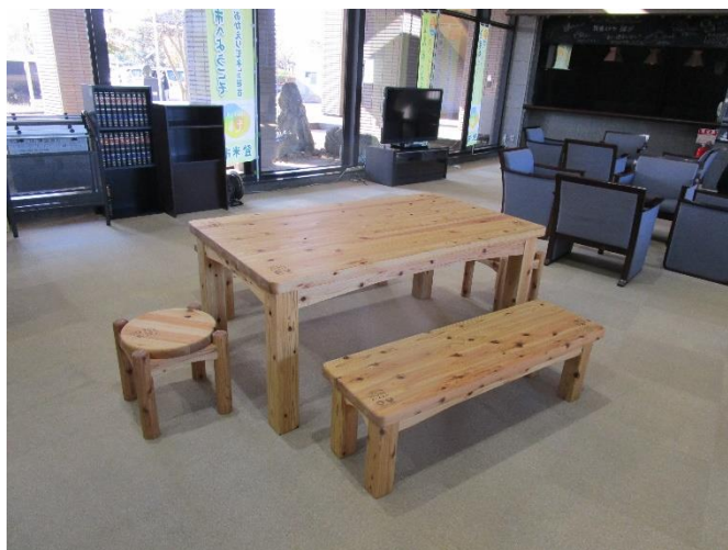
（中田総合支所設置状況）