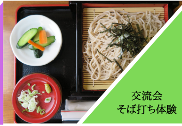
交流会 そば打ち体験