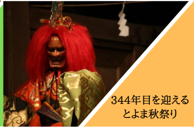
344年目を迎える とよま秋祭り