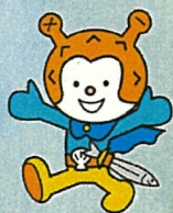
気仙沼市観光キャラクター 「海の子ホヤぼーや」