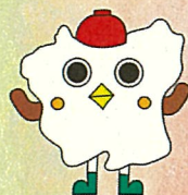
登米市観光PRキャラクター 「はっトン」