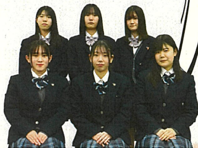
コラボ弁当プロジェクトの生徒の皆さん