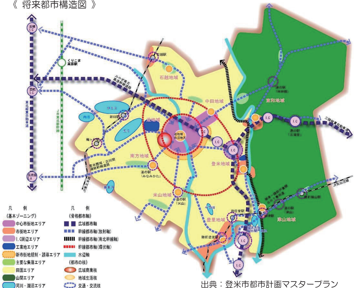
《 将来都市構造図 》

また、各地域に残る歴史・文化・伝統など特色を活かした地域の活性化や、三陸縦貫自動車道などの広域交通網を活かした広域的な交流・観光の促進を行うことにより、各地域が持続的に輝き続けられるようなまちづくりを目指すこととしています。