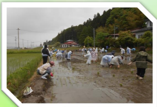
〈あぜ道から稲の苗を渡す作業〉