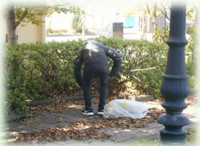
〈公園に落ちてる葉や枝を集めて袋詰め〉