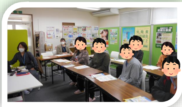
〈宮城県北部地方振興事務所県民サービスセンターの相談員さんによるセミナー風景〉