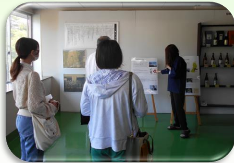
〈大崎市松山 株式会社一ノ蔵様の見学〉