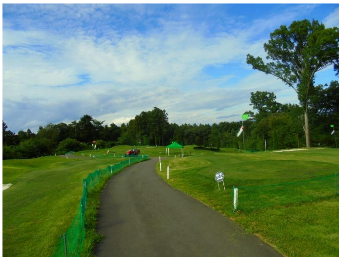
(さくらの丘コース)