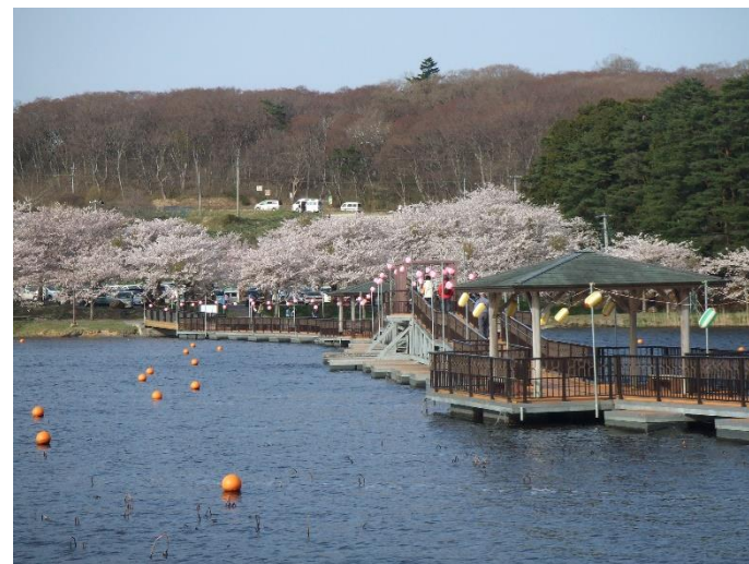
(イベント開催状況)