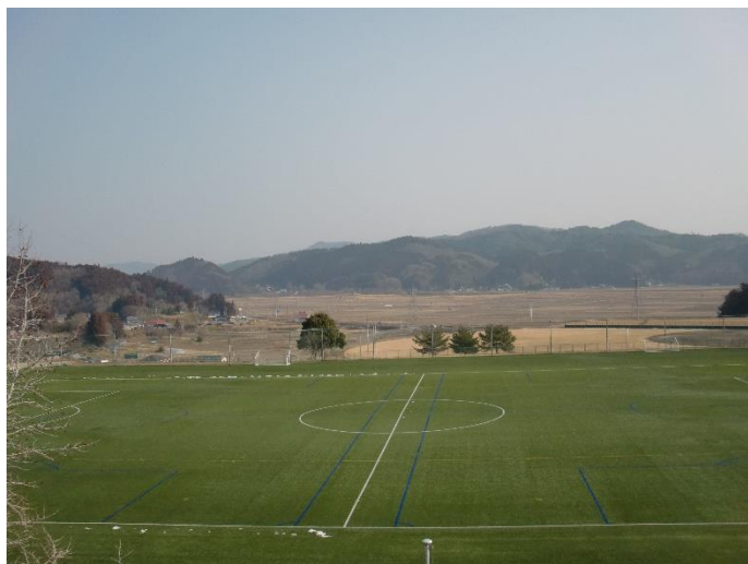
(多目的グラウンド①)