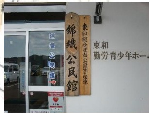
⑥箇所（建物入口看板）