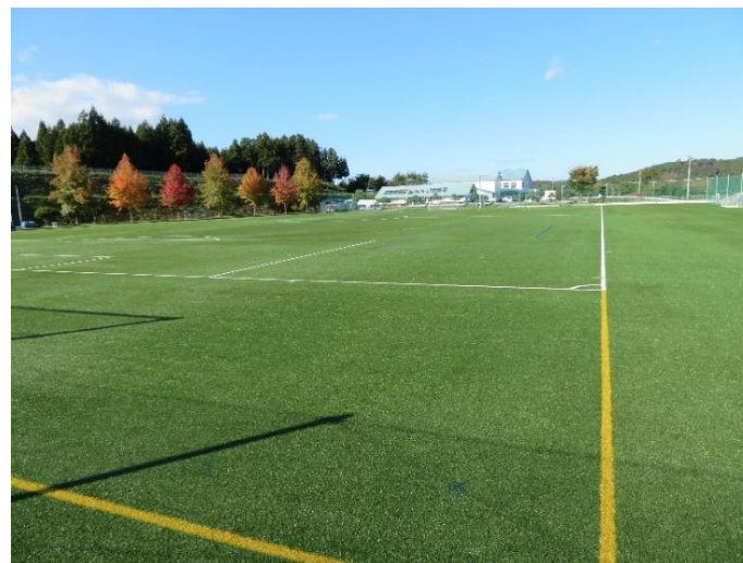
(多目的グラウンド②)