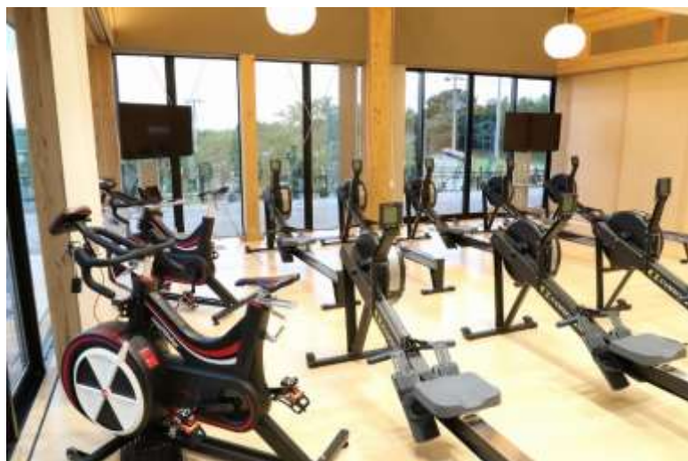
(トレーニングルーム)