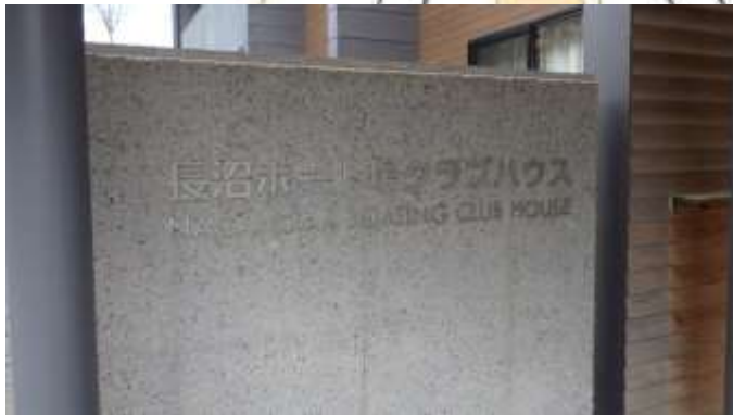
②箇所（建物入口サイン）