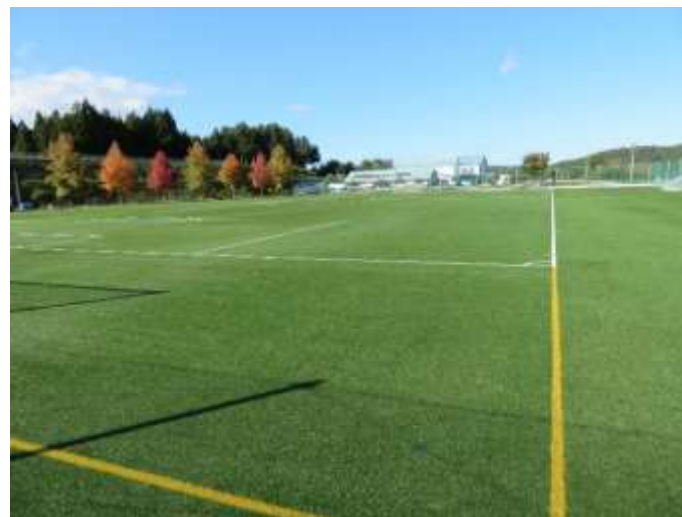
(多目的グラウンド②)