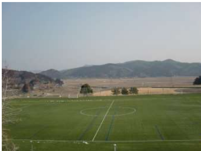
(多目的グラウンド①)