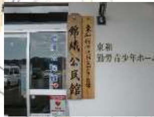
⑥箇所（建物入口看板）