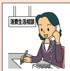
イラスト：消費者庁