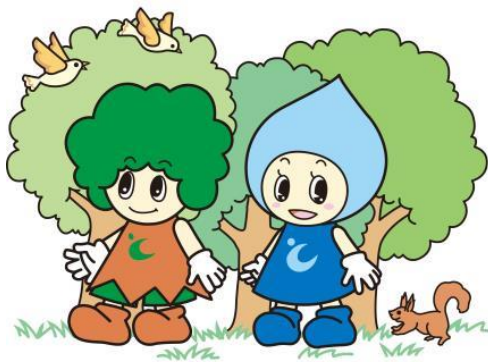
登米市環境キャラクター トメル君とオトメちゃん