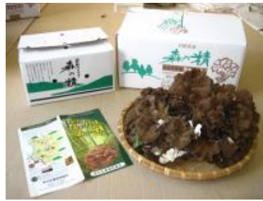
自然栽培マイタケ