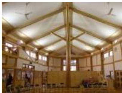
津山杉で建築されたつやま杉の子こども園（旧つやま幼稚園）

特用林産物については、原木しいたけや舞茸等のきのこ栽培やタラノメ、ワサビ等山菜の栽培、木炭の生産が行われ、地域の特産品として大きな役割を果たしているが、生産者の高齢化により、担い手の確保、生産性の向上が課題となっている。