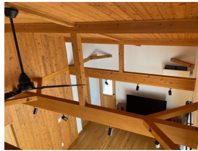
登米産材で建築された住宅