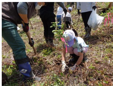
令和6年度市民参加の新たな森林づくり植樹祭の様子