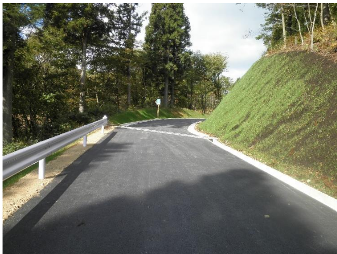
令和6年3月に整備が完了した林道登米東和線