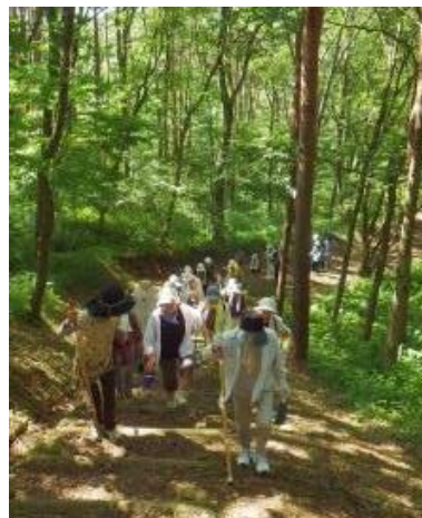
登米森林公園で健康づくり