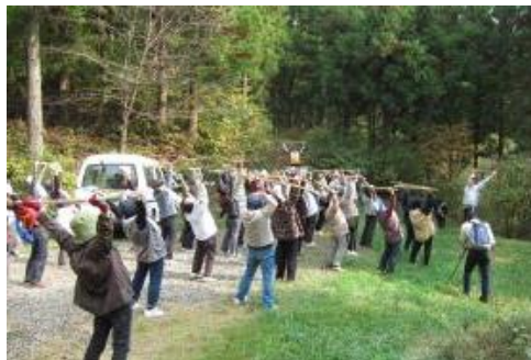
モリモリエクササイズ

登米市登米町日根牛上羽沢地区の登米森林公園を中心とした「登米ふれあいの森」が、平成20年4月に森林セラピー基地として認定されており、森林浴を通じて一人でも多くの人が、森林に癒され、森林づくりの大切さを理解していただけるよう、森林の多目的利用を推進する。