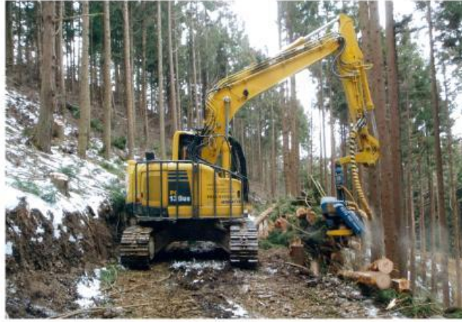
ハーベスタによる造材