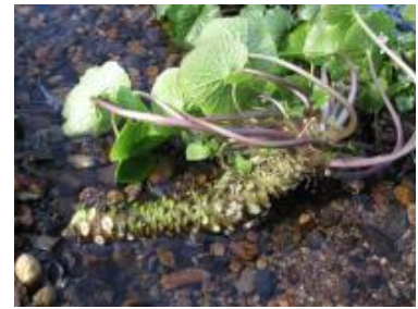
清流を活用したワサビ栽培