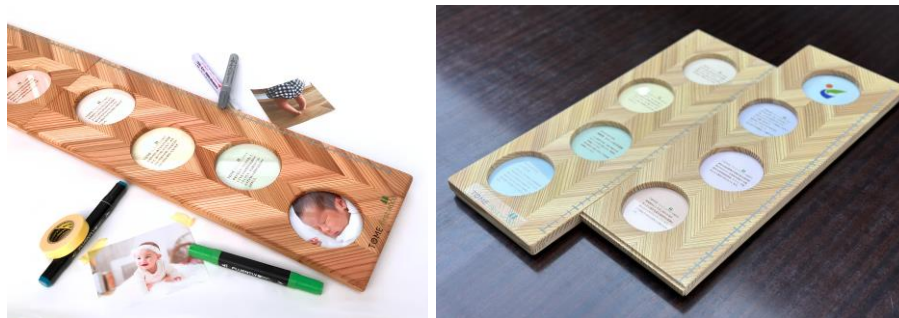
とめファーストウッド

また、とめファーストウッドなどの木育活動を積極的に実施し、市民に対する木材利用や森林・林業の重要性を発信する。