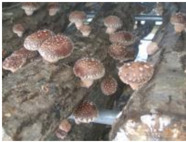
森林資源を活用した原木しいたけ

ウムが検出され、平成 24 年 4 月に出荷制限を受けている。また、森林が放射能により汚染されたことから、きのこ原木が供給不足になっており、今後も原木しいたけの産地として維持・発展していくためには、きのこ原木の生産供給体制の構築が必要である。