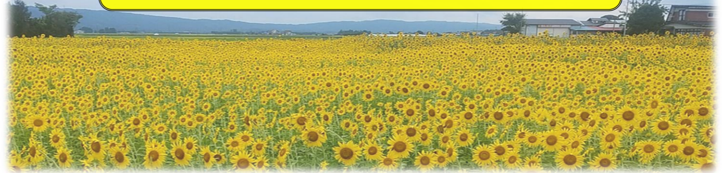
豊里町大曲で なかよく咲きそろう ひまわりたち