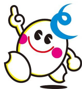
協働キャラクター「とめ丸」