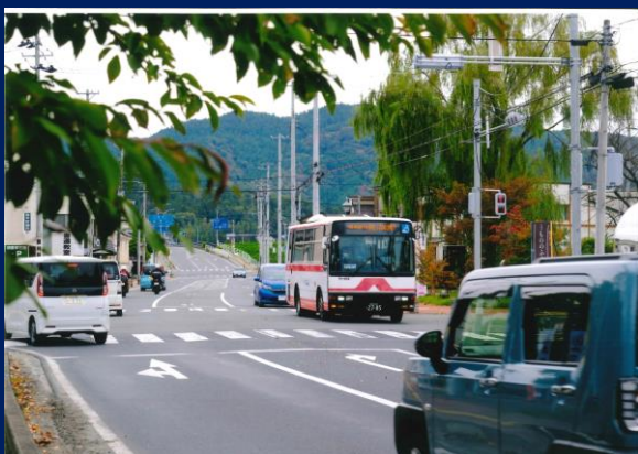
「宮城の明治村を走る」