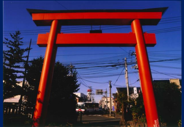
「見守られています、登米バス」