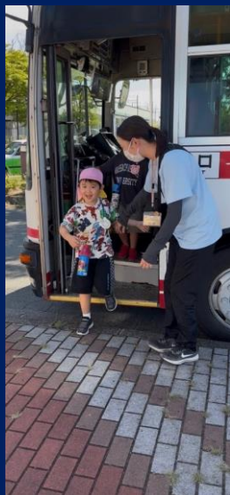
「はじめてのミヤコーバス」