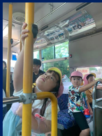
「初めてのボタン、押すよ〜！」