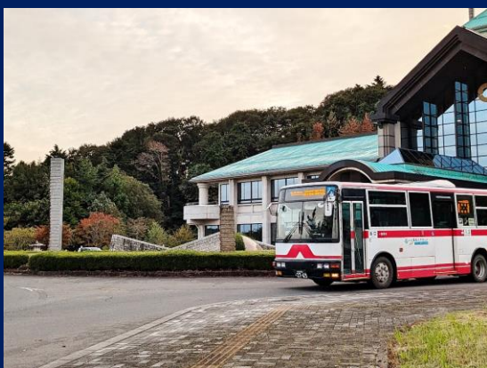
「宇宙との対話 石越で一献」