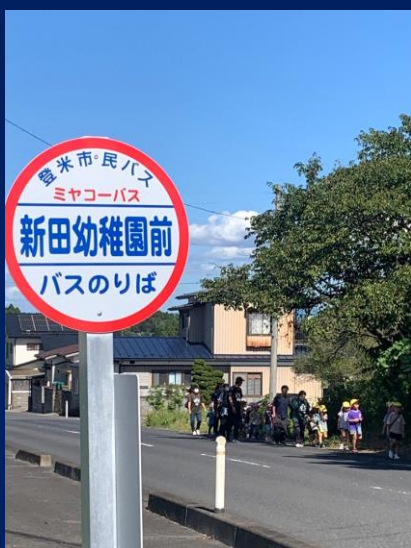
「市民バス、ドキドキするね！」