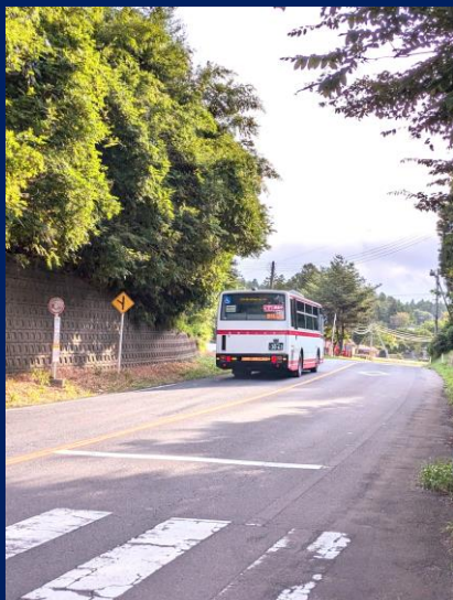
「100年以上変わらない割山バス停の風景」