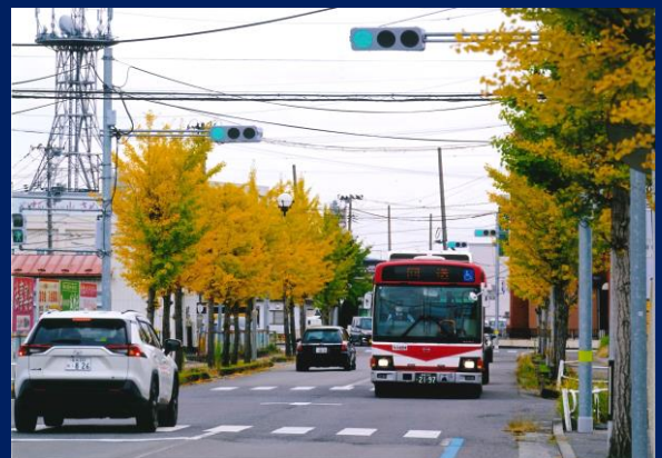
「晩秋・始発に向かって」