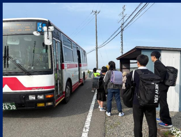
「老若男女～高校生に見守られて～」