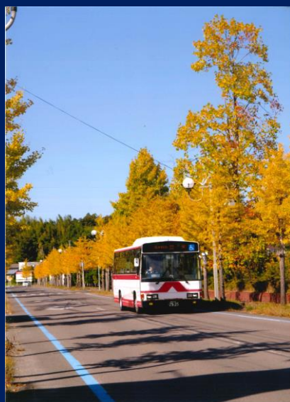
「バスに乗ってでかけよう！」