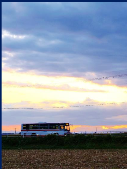
「あったかいわが家へ」