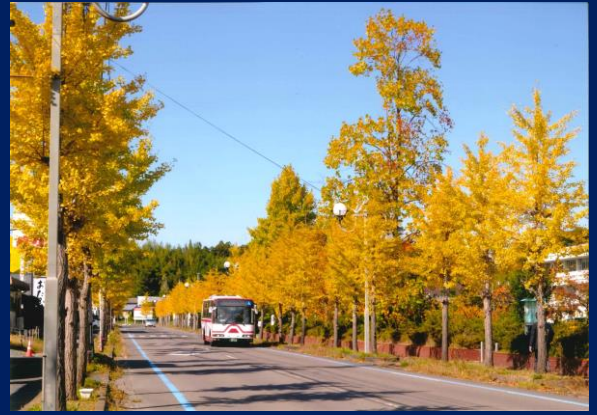
「バスも気持ち良さそう」