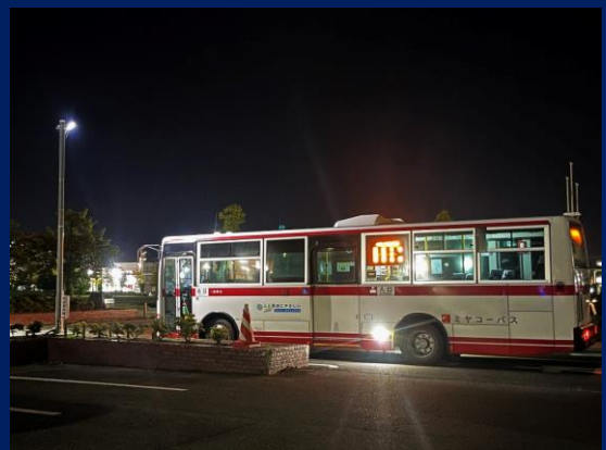
「スポットライトを浴びて」