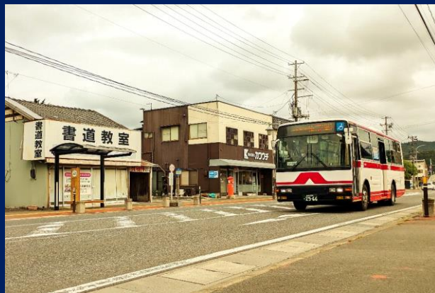
「変わらない登米の風景」