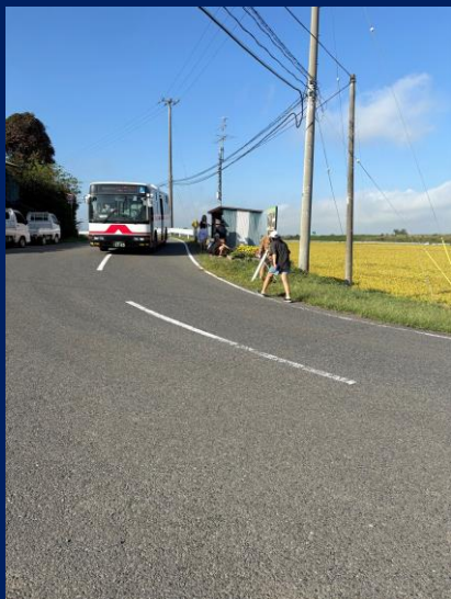
「毎日使うバス停をキレイに」