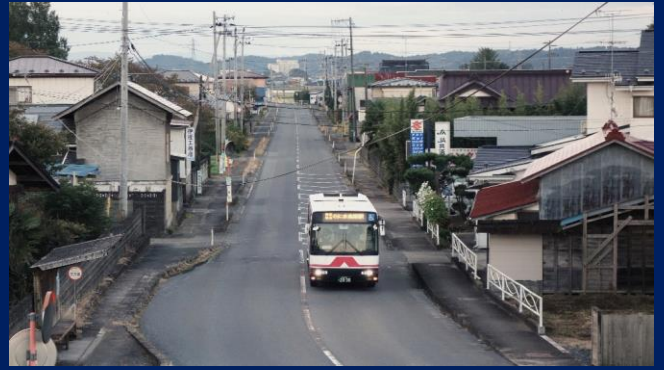
「旅の始まりはバスから」