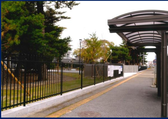
「孫もお世話になってます」