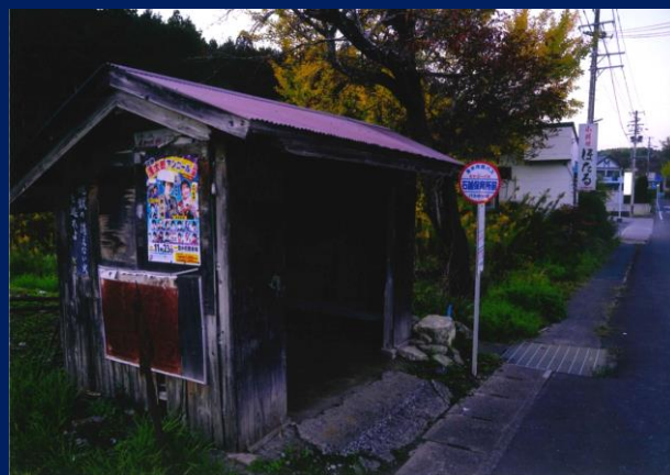
「いにしへの停車場」