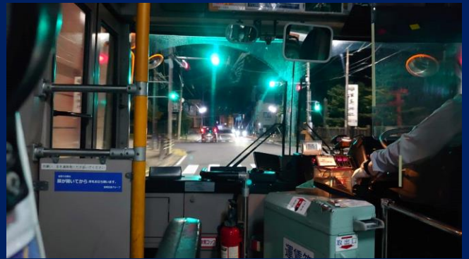
「呑んだらバスで帰ろう」