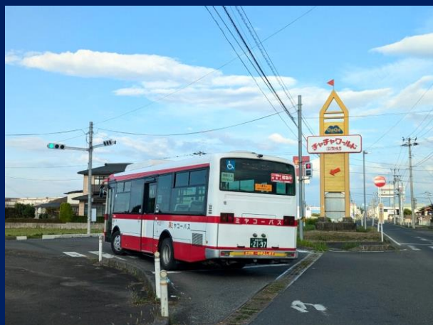
「チャチャワールドまであと少し」