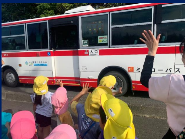
「運転手さん、市民バスありがとう」