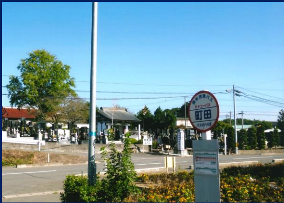
「町田バス停と松壽院」