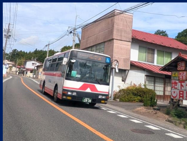
「ホーロー看板と芦倉バス停」