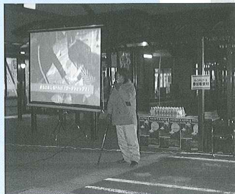
▲トリエンナーレを見逃した方も楽しめる 全作品を収録したDVD上映