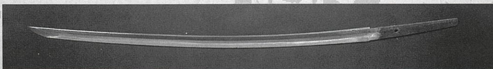
太刀 無銘 伝 兼延(当館蔵)