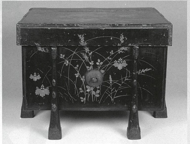
秋草蒔絵唐櫃(当館蔵) ※限定公開(9月21日~10月6日)

本企画展では宗根の没後350年を記念し、佐沼亙理家寄贈資料を中心に「伊達政宗の両親」、「伊達政宗と亙理宗根」、「伊達政宗のこどもたち」のテーマから、子であり父である政宗、政宗の子供たちとその周辺の人々(母親・傅役など)と宗根の足跡を紹介します。また、政宗のこどもたちの手紙や近年の佐沼亙理家文書調査で見出した伊達政宗書状など初公開となる資料も多数展示します。