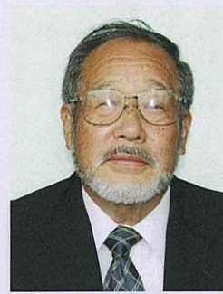
第6地区 (津山町柳津の区域) し ら い し ひ さ き 白 石 久 喜