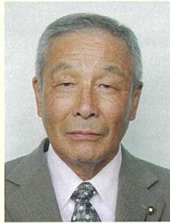
会長職務代理者(中田町)