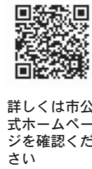
詳しくは市公式ホームページを確認ください

山吉田水門改良工事に伴い、市道穴山・南大畑線が8月下旬から令和5年3月末まで工事区間(切り直し道路)で、終日片側交互通行規制となります。片側交互通行期間中は、誘導看板、工事用信号機または誘導員の指示に従って通行してください。また、歩行者、自転車通行者は、工事現場脇