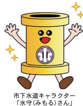
市下水道キャラクター「水守(みもる)さん」

宅および店舗付住宅 【補助対象者】①市税などの滞納がない人 ②下水道受益者負担金(分担金の滞納がない人) ③水洗便所改造資金融資あつせん くみ取り便所を水洗便所に改造する場合や、し尿浄化槽を取り壊して下水道に直接流す場合に、工事資金を無利子で融資します。希望する人は申請書を提出してください。 【融資あつせんの金額】建物1棟当たり120万円以内 【融資あつせんの対象者】①市税などの滞納がない人 ②下水道受益者負担金(分担金の滞納がない人) ③月々の返済ができる所得のある人 ④市税などの滞納がない保証人(1人)も