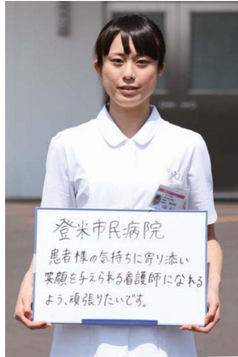
あなたも市立病院の看護師を目指しませんか。

市は、看護師として将来市立病院での勤務を考えている看護学生に奨学金を貸し付けます。