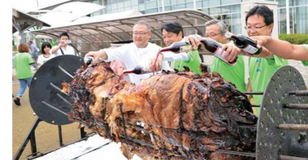
もっこり牛まつり 8月14日

1 神輿渡御では、津島神社やとめ青年会議所、みやぎ登米農協などのみこし6基がそろい、威勢よい掛け声が響いた。2 軽快なおはやしに合わせ幻想的で華麗な「豊里ねぶた」練り歩き、「よさこい」では見る人も演じる人も盛り上がった。3 恒例のもっこり和牛丸焼き。一晩かけて焼き上げ、ワインで仕上げた牛肉はまさに逸品