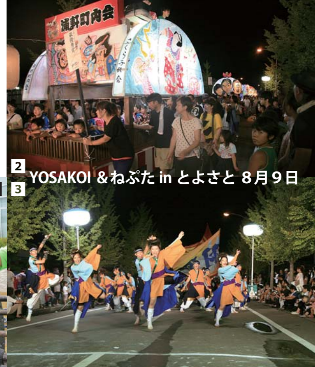
2 YOSAKOI & ねぶた in とよさと 8月9日