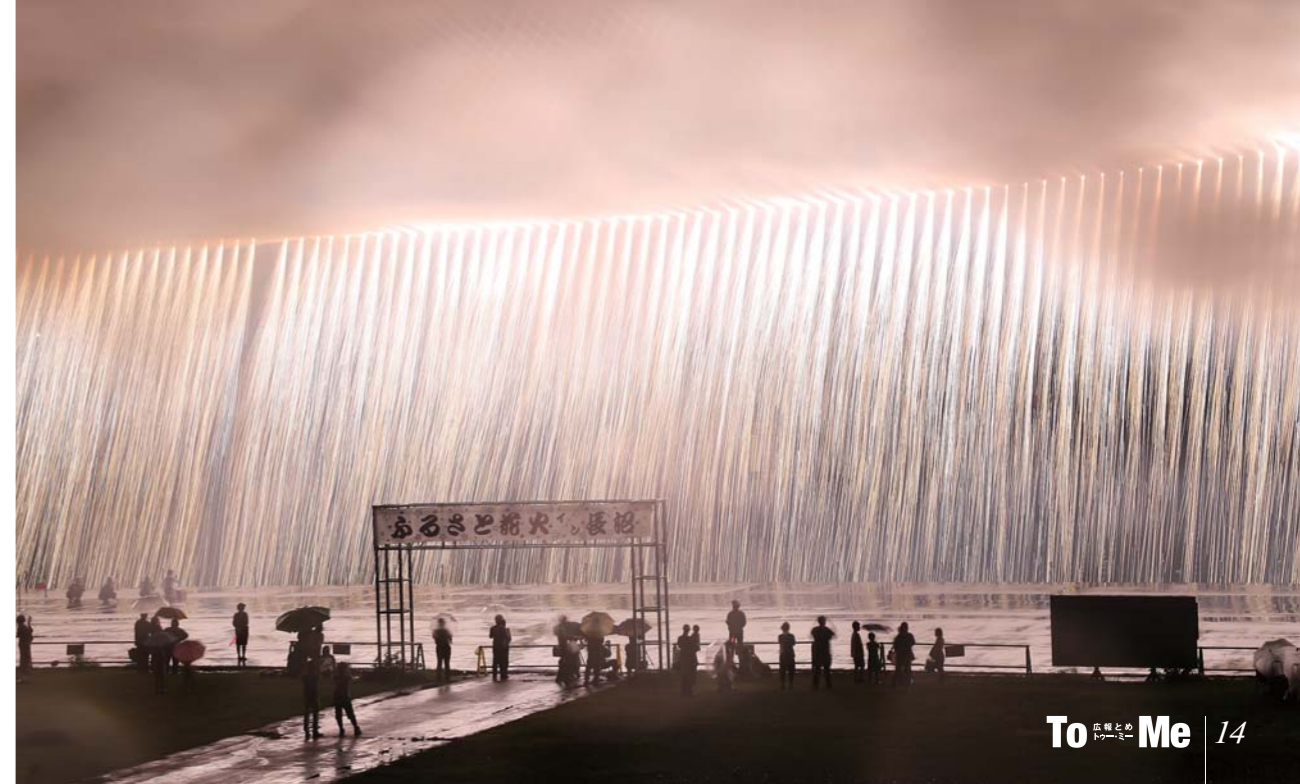
5 ふるさと花火 in 長沼 8月14日

5 みんなの募金で長さが変わる名物ナイアガラ花火。今年も全長200mを超え、雨の中訪れた見物客を魅了した