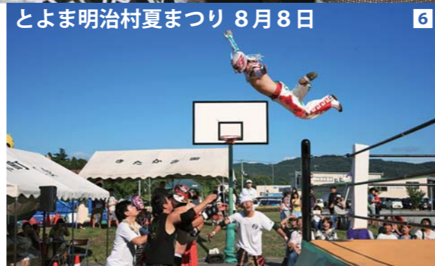
とよま明治村夏まつり 8月8日