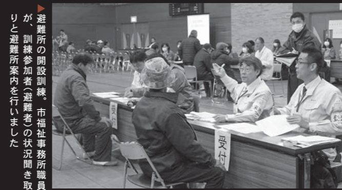
避難所の開設訓練。市福祉事務所職員が、訓練参加者(避難者の状況聞き取りと避難所案内を行いました)