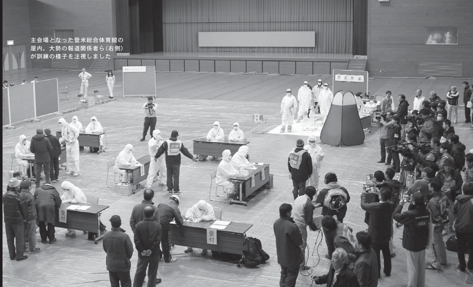
主会場となった登米総合体育館の屋内。大勢の報道関係者ら(右側)が訓練の様子を注視しました

県と本市を含む関係市町は合同で、東北電力女川原子力発電所で事故が発生した場合に備え、1月27日に原子力防災訓練を実施しました。訓練は、女川原発から30 + 圏内の7市町(登米市、石巻市、東松島市、女川町、南三陸町、美里町、涌谷町)が対象。本市の登米総合体育館で実施された住民避難訓練には、女川原発から30 + 圏内にある本市の豊里、津山地区をはじめ関係市町から約200人が参加しました。