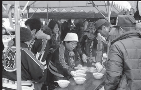
気温が低い中で訓練。市婦人防火クラブ登米支部による炊き出しが、参加者の体と心を暖めました