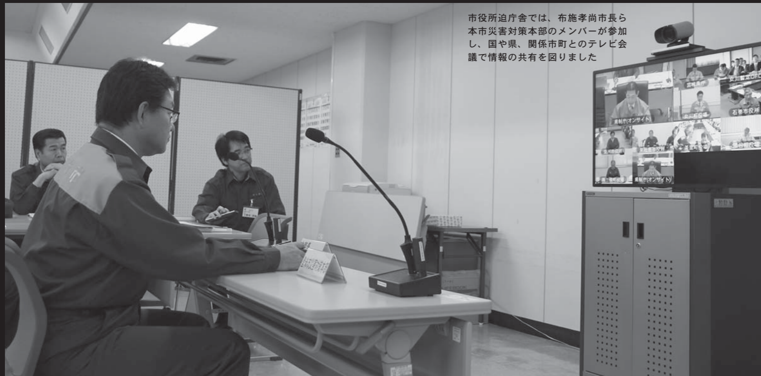
市役所庁舎では、布施孝尚市長ら本市災害対策本部のメンバーが参加し、国や県、関係市町とのテレビ会議で情報の共有を図りました