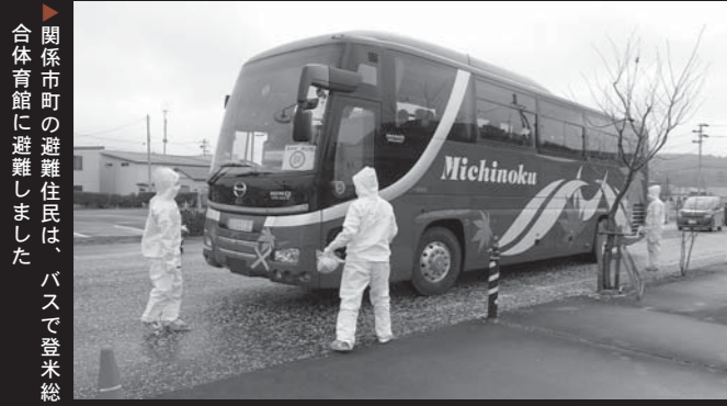
関係市町の避難住民は、バスで登米総合体育館に避難しました