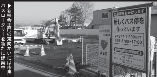
▶新校舎正門の東向かいには市民バスロータリーを新たに建築中