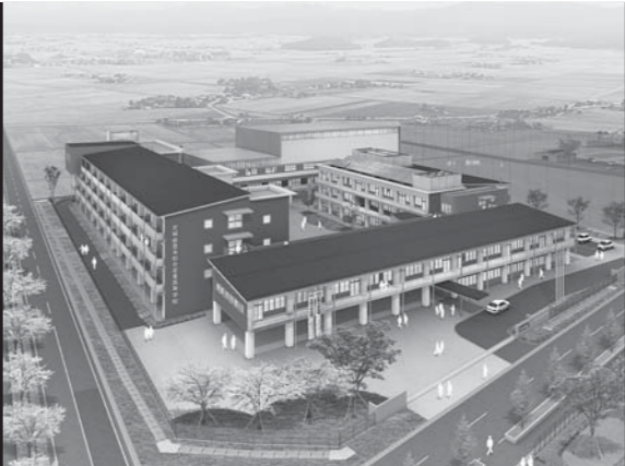
◀新校舎完成予想図/農業実習棟、第3グラウンド(硬式野球場)の工事も始まりました