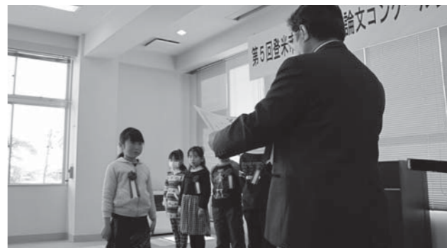
入賞者には島山教育委員長から表彰状などが授与されました。