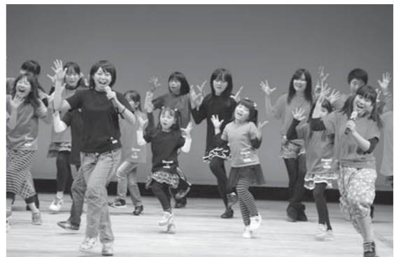
会場を盛り上げた劇団ドリーム☆キッズのはつらつとした歌と踊り