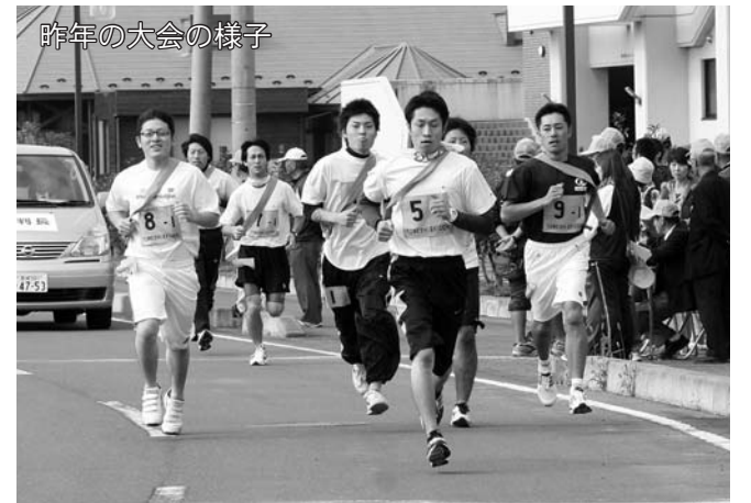
昨年の大会の様子

市では昨年に引き続き、広く市民がスポーツに親しみ、健康の維持や世代を超えた相互の親睦と交流を目的に「第2回登米市駅伝競走大会」を開催します。 大勢の皆さんの参加をお待ちしています。