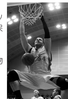
▲クリス・ホルム選手の力強いダンクシュート