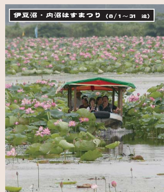
伊豆沼・内沼はすまつり (8/1~31 追)