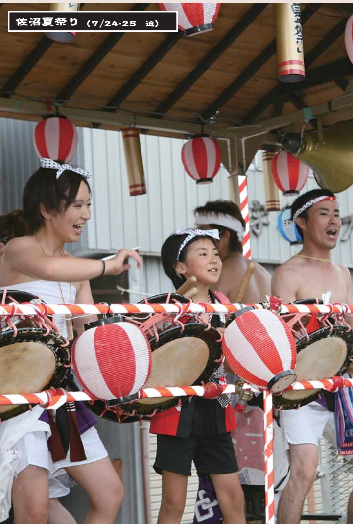
佐沼夏祭り (7/24・25 追)