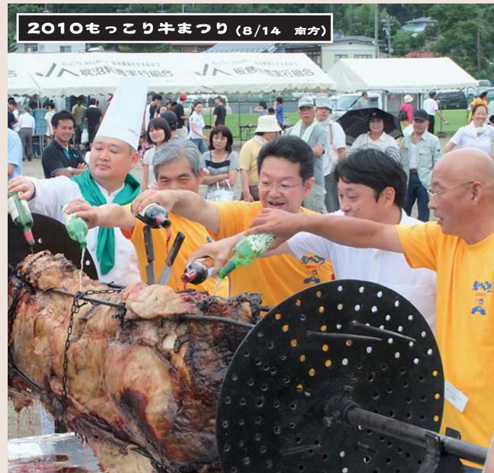
2010もっこり牛まつり (8/14 南方)