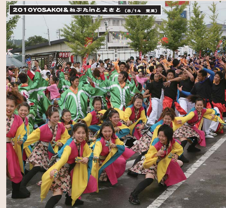
2010YOSAKOI&ねぶたinとよさと (8/14 豊里)