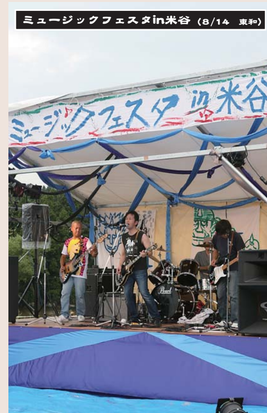
ミュージックフェスタin米谷 (8/14 東和)