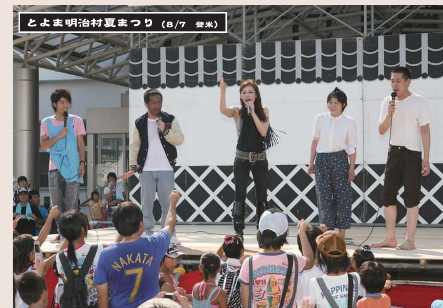
とよま明治村夏まつり (8/7 登米)