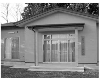
▲山吉田行政区で整備したコミュニティセンター