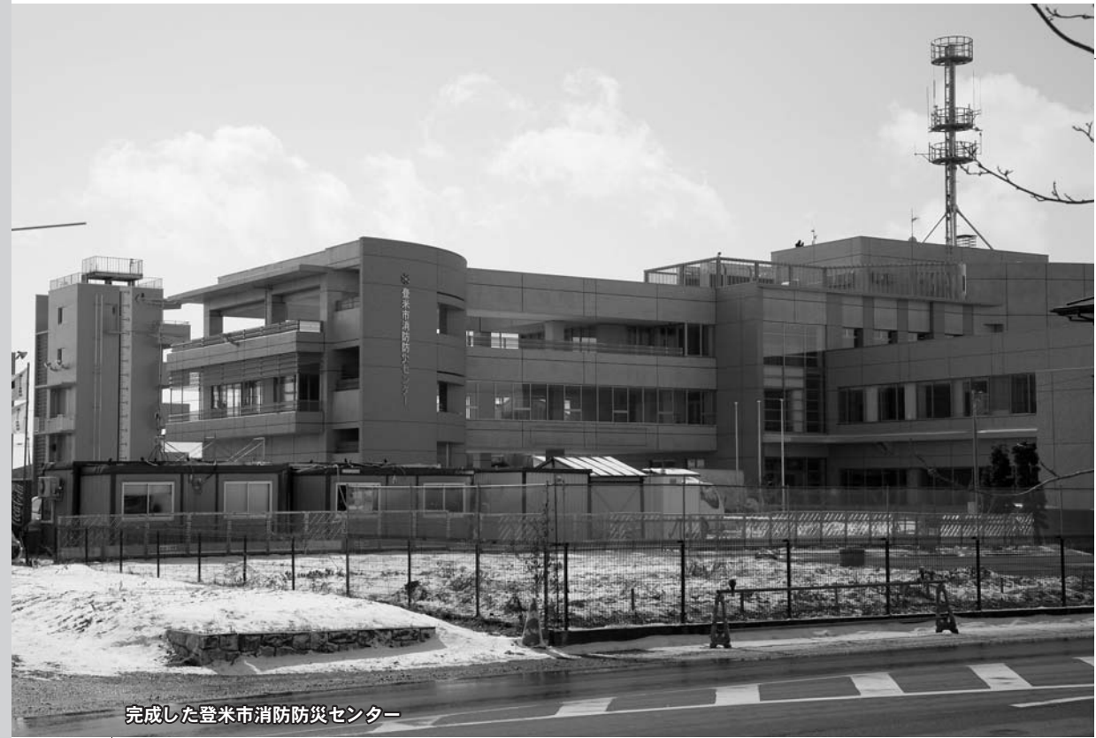
完成した登米市消防防災センター

登米市民の防災拠点として整備を進めてきた「登米市消防防災センター」が完成しました。完成に伴い、「登米市消防本部」「登米市消防署」が移転し、平成20年3月17日から新庁舎で業務を開始します。新庁舎は消防機関のほか、地震・避難・通報体験など防災啓蒙機能を備えた防災拠点となっています。また、多岐災害に対応できる訓練施設やコンピューターによる災害現場の特定、出場指令の時間短縮など、市民の安全・安心を守るための施設となっています。