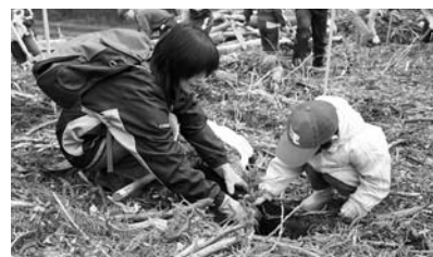
4月の植林体験の様子

産業経済部農林振興課 林業振興係 ☎ 0220 (34) 2716 FAX 0220 (34) 2801