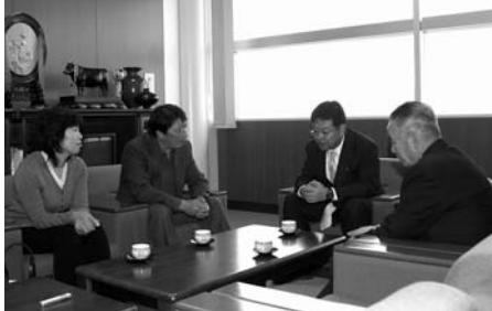
毎回、活発な意見交換が行われています

〒987-10511 登米市迫町佐沼字中江二丁目6番地1 総務部総務課 広報係 ☎0220(22)2090 FAX0220(22)9164 ✉koh@city.tomeniyagi.jp