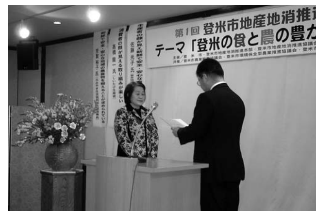
地産地消推進店に認定された販売店には地産地消推進本部長（布施市長）から認定証が手渡されました（11/18地産地消推進のつどい）

認定を受けた推進店は、市内産農産物を積極的に使用、または市内産農産物を使用した加工品を、今後も増やして