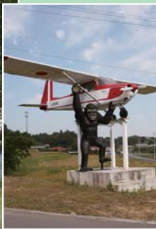
ゴルフ場入口にあるセサナとゴリラのオブジェが目印

米山町桜岡の「豊愛の里」に、市内では民間初のパークゴルフ場が10月1日からオープンしました。ゴルフ場は全18ホール、全長975mで、美しい緑に囲まれた本格的なコース。年中無休で1年を通して子どもから大人まで楽しめます。敷地内には、岩盤浴「米山岩薬癒」や本格手打ちそば「竹庵」も併設されています。家族や仲間と気持ちのいい汗を流してみませんか。