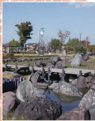
加賀野地区の住宅街に囲まれ、休日になると家族連れでにぎわう「かがの公園」

わせ、水を使って浮いています。石はブラジル原産の青色系の御影石で、同種の石の球体としては世界最大級のものといわれていますが、