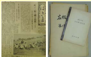
昭和30年代の広報紙

「アーカイブズ」という言葉を知っていますか。これは、文書を歴史資料・文化資料として保存・管理・閲覧できる「文書館」や「公文書館」をいいます。行政文書や地図など、当時の様子を記録した文書が保管の対象となります。皆さんが身近で読んでいた広報紙。最初は公民館だよりとしてスタートした地区が多かったようですが、昭和30年代から40年代にかけて、各町の出来事などをお知らせする「広報紙」として発行されるようになりました。現在は当時の生活を知る貴重な資料となっています。