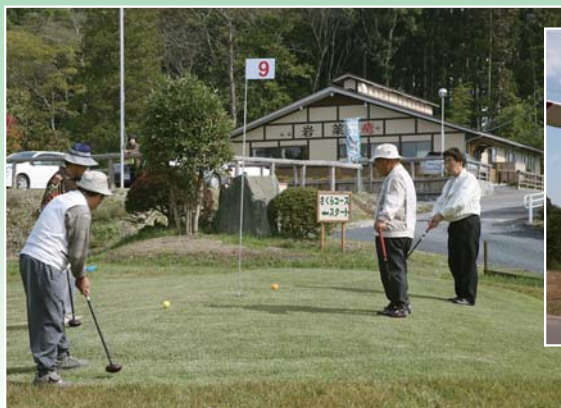
ゴルフ場は全18ホールあり子どもから大人まで楽しむことができます