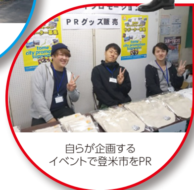
自らが企画する イベントで登米市をPR