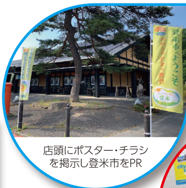
店頭にポスター・チラシ を掲示し登米市をPR