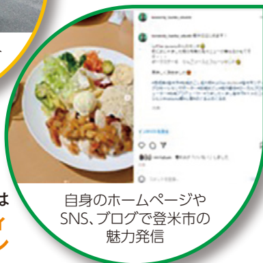
自身のホームページや SNS、ブログで登米市の 魅力発信