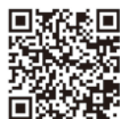
トメのコメジルシ Instagram