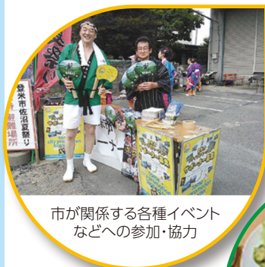
市が関係する各種イベント などへの参加・協力