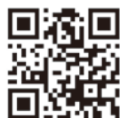
登米市シティ プロモーションサイト トメのコメジルシ