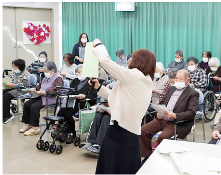
中田デイサービスセンター菊風荘で実施した出張市役所。詐欺などの手口や被害に遭わないための対策などについて消費生活相談員が説明

「自分はだまされない」と思って しまう要因はさまざまあります が、これまで積み重ねた経験や知 識が過信につながり、結果として 被害に気付きにくくなることがあ