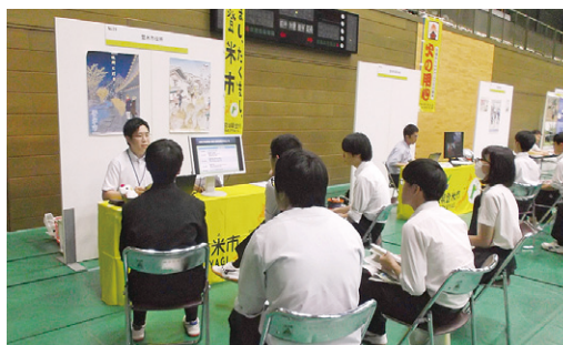
昨年の就職ガイダンスの様子