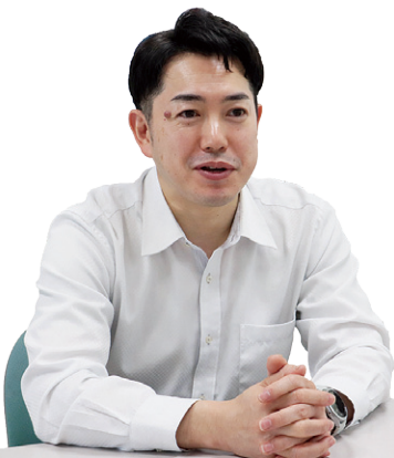
登米警察署 生活安全課

「みんなで登米っぺ詐欺被害！」を合言葉に、被害に遭わないよう、常に注意してください。