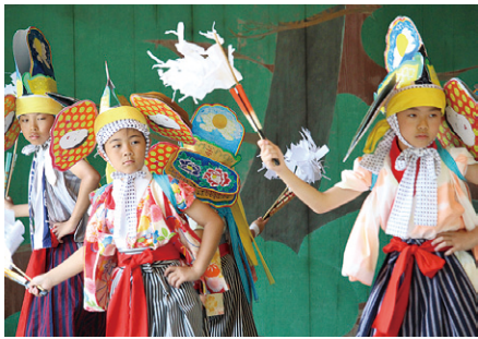
とめ伝承芸能まつりで神楽を披露する子どもたち

子どもたちによる神楽や打囃子の他、市内の民俗芸能団体が出演。ゲストとして石巻市指定無形民俗文化財「女川法印神楽」(石巻市)も披露されます。