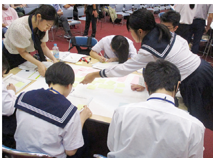
令和7年度ジュニアミーティングの様子

☎02220(58)5553 ✉kankyoo@city.tome.miyagi.jp