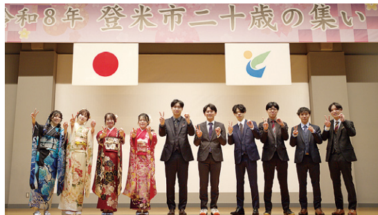
令和8年二十歳の集い実行委員の皆さん

●令和9年二十歳の集い 20歳を迎える人たちの健やかな心身の成長と社会人としての門出を祝し、「登米市二十歳の集い」を開催します。 【日時】令和9年1月10日(日)午後1時(受付)午前11時30分〜午後0時30分) 【場所】エスビー食品とよま蔵ジァム(登米総合体育館) 【対象者】平成18年4月2日から平成19年4月1日までに生まれた人で、次に該当する人 1 市内の中学校を卒業した人 2 令和8年9月1日現在で市内に住所を有する人 3 前記以外で登米市二十歳の集いに出席を希望する人(要申し込み) ※市内の小学校を卒業以降、進学などの理由で現在市内に住所がない人は③に該当しますので、出席を希望する場合は必ず申し込みください ※対象者には、10月頃に案内状を送付します。当日は、案内状を必ず持参してください。また、案内状が12月上旬までに届かない場合は問い合わせください