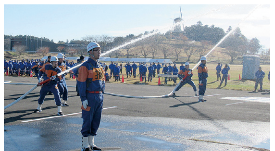
昨年度の消防団演習で放水訓練をする消防団員

消防団の知識と技術の向上を目的に、「登米市消防団演習」を開催します。 当日は、市内9支団から約500人の団員が参加し、分列行進、機械器具点検、小型ポンプ操法など、規律ある消防団員の活動訓練を披露します。訓練の様子は見学することができます。 とができます。 【日時】7月5日(日)午前8時〜11時 【場所】長沼フットピアトヨテツの丘公園、アイエス総合ポートランド 【問い合わせ】消防本部警防課(消防団係) ☎02220(22)1901