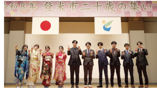
令和8年二十歳の集い実行委員の皆さん

● 実行委員を募集 対象者で、二十歳の集いの企画・運営に協力する実行委員を募集します。活動は月1回程度です。希望する人は、電話か電子メールで申し込みください。(電話の場合は、平日午前9時から午後5時まで) 【申込期限】 7月31日(金) 【申し込み・問い合わせ】 教育委員会教育部生涯学習課(生涯学習推進係) ☎0220(34)2698 ✉syogagakusyu@city.tome.miyagi.jp