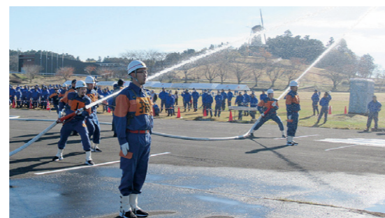
昨年度の消防団演習で放水訓練をする消防団員

とができます。 【日時】 7月5日(日)午前8時～11時 【場所】 長沼フットピアトヨテツの丘公園、アイエス総合ポートランド 【問い合わせ】 消防本部警防課(消防団係) ☎0220(22)1901