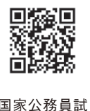
国家公務員試験採用情報NAVI

国家公務員 税務職員を募集 税務のスペシャリストとして、国の財政を支える税務職員を募集しています。 【受験資格】①令和8年4月1日において高校または中等教育学校を卒業後3年を経過していない人および令和9年3月までに高校または中等教育学校を卒業見込みの人②人事院が①に準ずると認める人 【申込期間】6月12日(金)から24日(水)まで 【申込方法】インターネット申し込み 【第1次試験】9月6日(日) 【問い合わせ】仙台国税局人事第二課試験研修係 ☎ 022(263)1111 (内線3236)