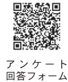
アンケート回答フォーム

支援課で保管しています。必ず事前に連絡の上、来庁ください。併せて、商品券の利用についてアンケート調査を実施しています。皆さんのご意見をお寄せください。 ●商品券について 【使用期限】6月30日(火) 【商品券受取時間】平日/午前8時30分～午後5時15分 【受取場所】産業経済部地域ビジネス支援課