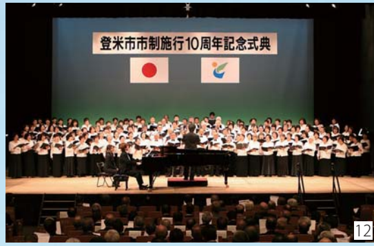
12 市制施行10周年記念式典では、10周年を記念して制定した市民歌を約170人が合唱。美しい歌声で式典に花を添えた13 合唱の伴奏は本市出身で世界的ピアニストの及川浩治氏が務めた