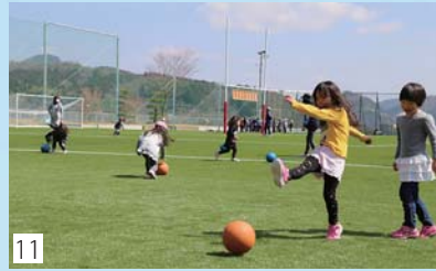
10 東日本大震災で甚大な被害を受けた東和総合運動公園 11 石巻市や南三陸町などの沿岸部からの避難者を受け入れ、ピーク時には6230人が市内53箇所の避難所に身を寄せた10 東日本大震災からの復興を祈念して開催された東北風土マラソンには国内外から1233人のランナーが集結11 東和総合運動公園に、雨が降っても使用できる人工芝の多目的グラウンドがオープン