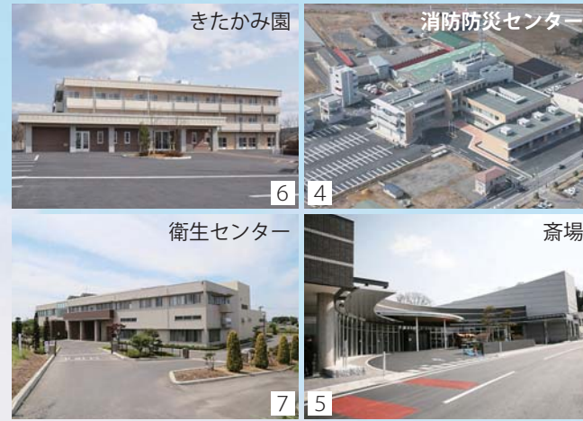
1 登米郡8町と本吉郡津山町が合併し、平成17年4月1日に登米市が誕生。迫庁舎の玄関前で開庁式が行われた2 市長選に当選し、初登庁する布施前市長 3 約700人が出席した開市記念式典で、720点の応募の中から選ばれた市章が披露された4 5 6 7 市制施行5年の節目までに、合併の契機となった消防防災センターなど広域4事業の整備が完了。防災、環境衛生、高齢者福祉の拠点施設が完成した