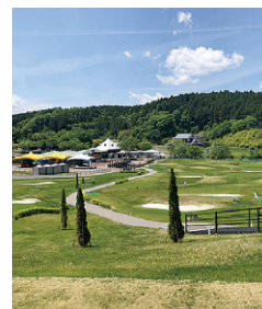
▲募集施設＝高森パークゴルフ場