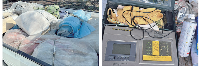
集積所に出された粗大ごみ 分別されず出された家電など