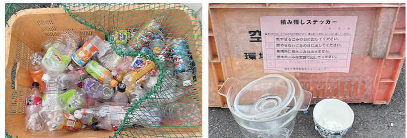
ラベルを貼ったまま出されたペットボトル 資源ごみとして出せないガラス類・せともの

集積所、リサイクルステーションに出せない粗大ごみ(布団・じゅうたんなど)、産業廃棄物(農業用ビニールなど)、分別されていないごみが出された場合には、積み残しステッカーを貼り回収していません。ルールが守られないと、集積所などを管理している行政区などの迷惑になります。ごみ出しのルールを守って、気持ちよく生活できるよう、ご協力をお願いします。